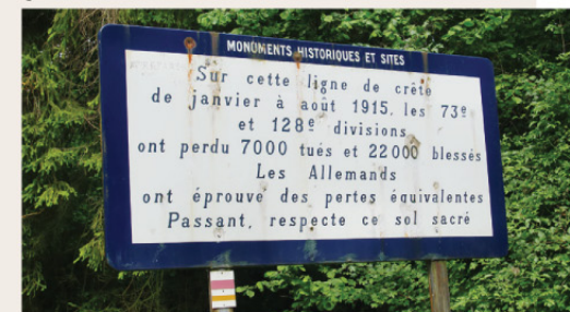
Site de la Croix des Carmes.

des sapes, sur ce qui étaient les premières lignes françaises et allemandes. Cet espace boisé et agricole recèle également quelques stèles et monuments ainsi qu'une nécropole nationale, regroupant les combattants des deux guerres mondiales.