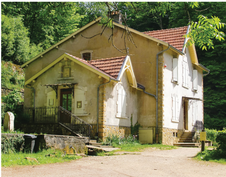
Maison forestière du Père Hilarion.

Rejoignez-nous et randonnez l'esprit libre