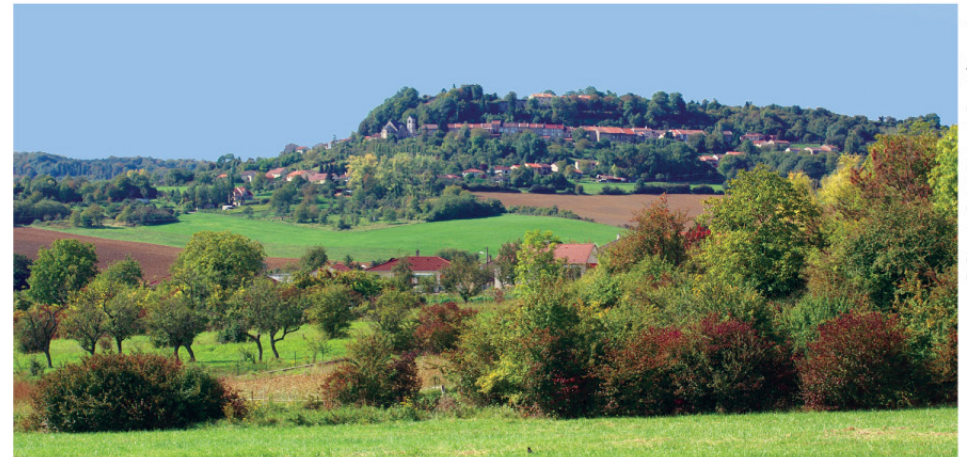
Le village de Prény.