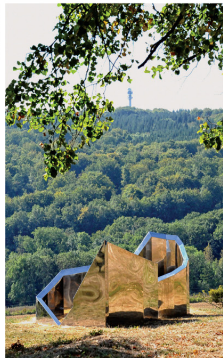
L'œuvre X, Y, Z / 3 lignes sur plan .

1 Du parking de la mairie, se diriger vers le château (portion commune avec le sentier GR® 5).