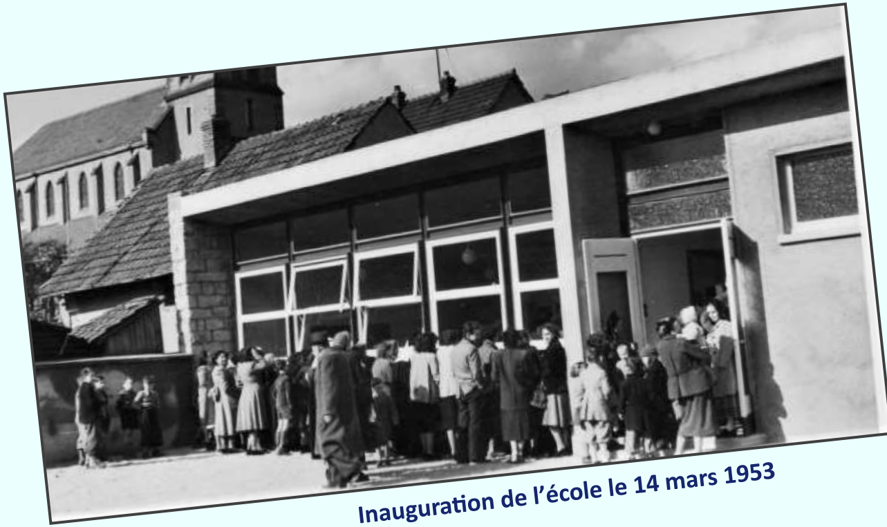
Inauguration de l'école le 14 mars 1953