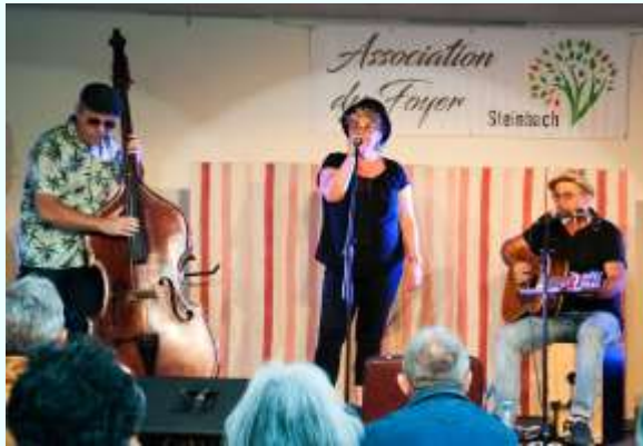
8/9/10 juillet : nouvelle formule pour le 8 e Festival d'Été , organisé par l'Association du Foyer. Les animations, plus nombreuses et variées, visant un public plus large, sont regroupées sur 3 jours consécutifs.