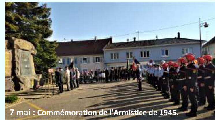
7 mai : Commémoration de l'Armistice de 1945.

8 mai : inauguration de l'aménagement du plateau sportif par les scouts (voir page 17).