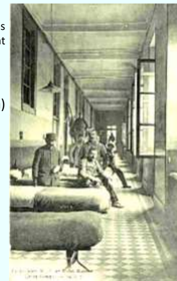
Une inscription au dos de la carte révèle que JF Jiguet séjourna dans cette salle du Centre de la Croix Rouge de Lyon