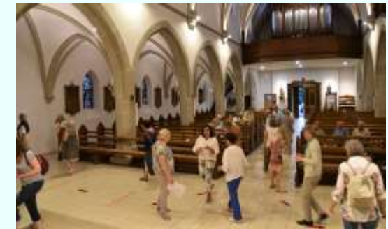
16 juillet : lors de la « Nuit des Églises », organisée par la Pastorale du Tourisme sur le thème de « L'Église au jardin », découverte d'un très beau jardin de Steinbach et des représentations de végétaux dans l'église.