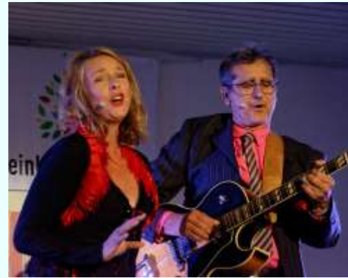
8 juillet : Avec les trois troubadours de « Myris et les Swampeux », voyage aux Blues des origines, de Chicago à New-Orleans. Avec « Fusibles et Dentelles », des chansons françaises aux textes pleins d'humour, d'amour et un brin érotiques.