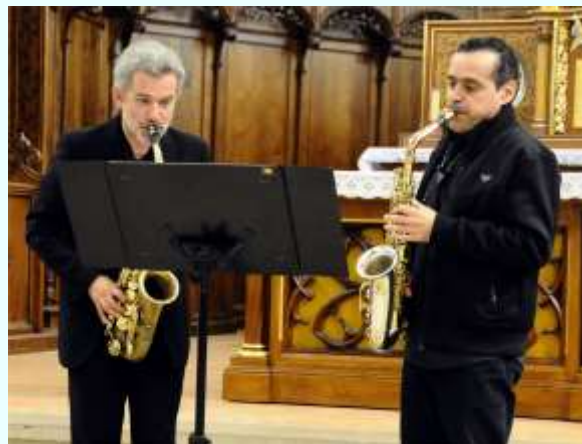
18 septembre : Rodrigo Capistrano, saxophoniste brésilien de renommée internationale, a surpris et conquis l'auditoire par sa virtuosité et le choix des œuvres interprétées, tirées de son récital « Solo pour la paix ». Duo de compagnons saxophonistes avec Olivier Werly.