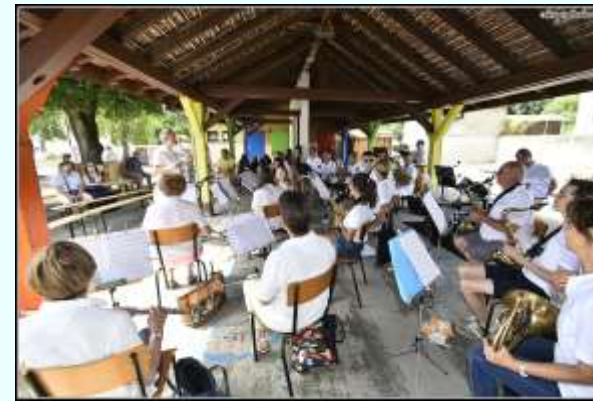
9 juillet : Apéritif-concert donné par l'Harmonie du Silberthal, sous le préau de l'école.