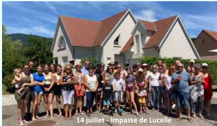
14 juillet - Impasse de Lucelle