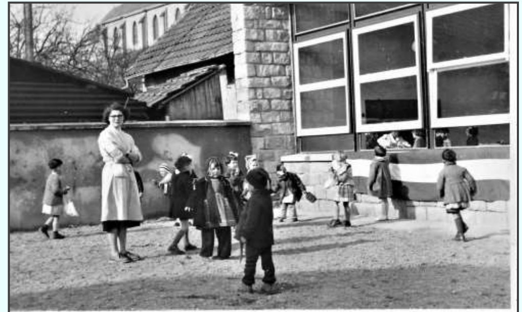
Mademoiselle Abt surveillant la cour de récréation