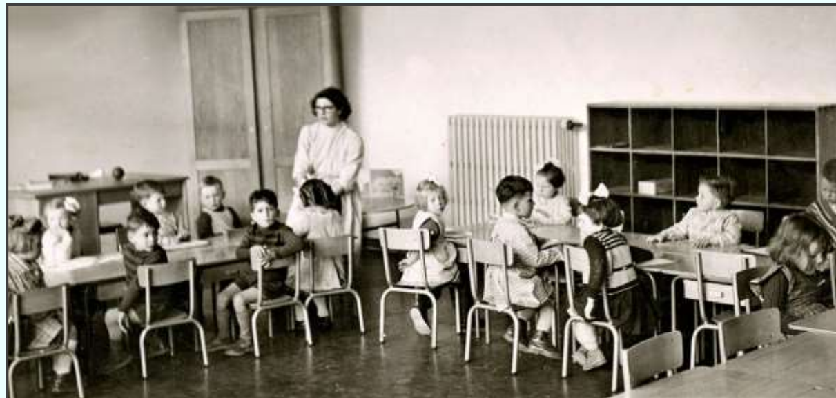
Salle de classe dans les années 50