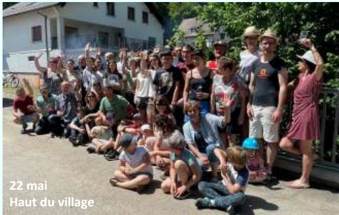
22 mai Haut du village

F comme Fêtes des voisins , un moment de partage et de convivialité dans différents quartiers de Steinbach.