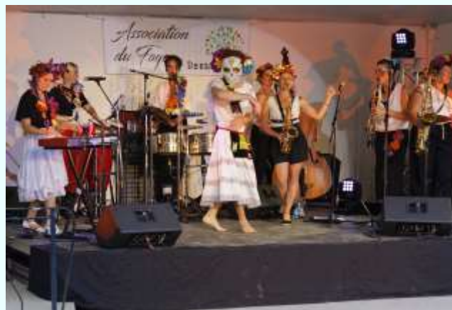
Le soir, les 7 artistes musiciennes de « Las Gabachas de la Cumbia » dansent sur de la musique traditionnelle argentine.