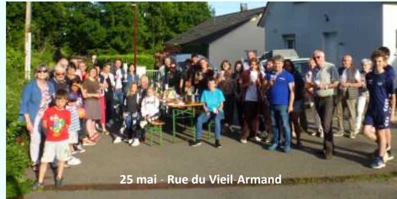
25 mai - Rue du Vieil-Armand