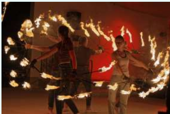
Belle surprise non programmée, la troupe Quendor offre un lumineux spectacle de jonglage et de pyrotechnie.