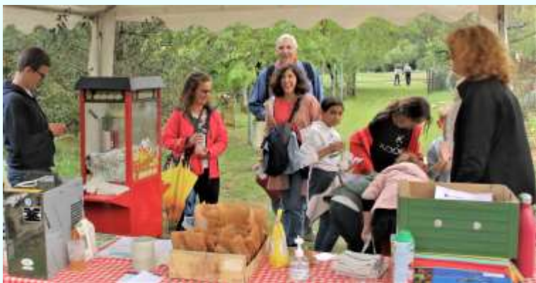
24 septembre : « Steinbach dans tous les sens », balade gourmande pour petits et grands, organisée par l'Association du Foyer, ponctuée d'étapes gourmandes (dégustations insolites) et ludiques (jeux, devinettes, peinture).