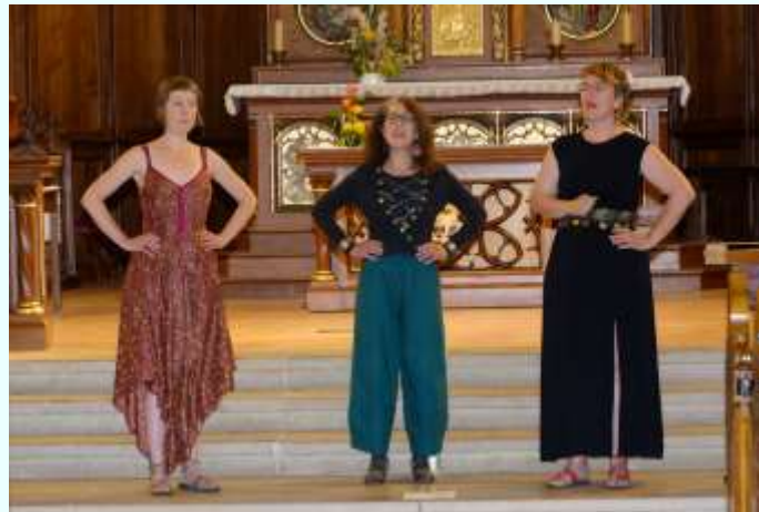
10 juillet : dans l'église du village, le « Trio Ispolin » chante des légendes bulgares centenaires.