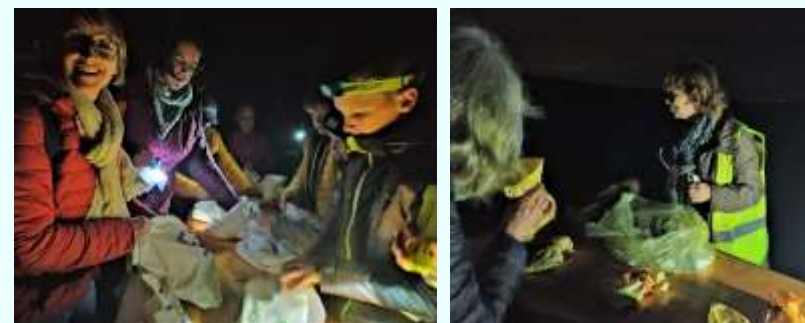
15 octobre : 5 e édition du « Jour de la Nuit », organisée par Steinbach et Uffholtz, sur le thème des animaux nocturnes et des « Cinq sens la nuit ».