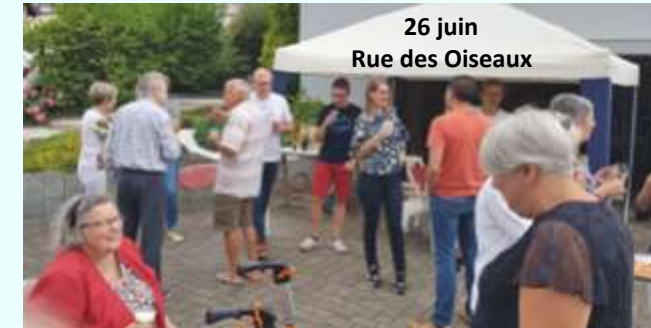
26 juin Rue des Oiseaux