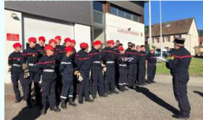
26 juin Journée fin de session des JSP (Jeunes Sapeurs-Pompiers).