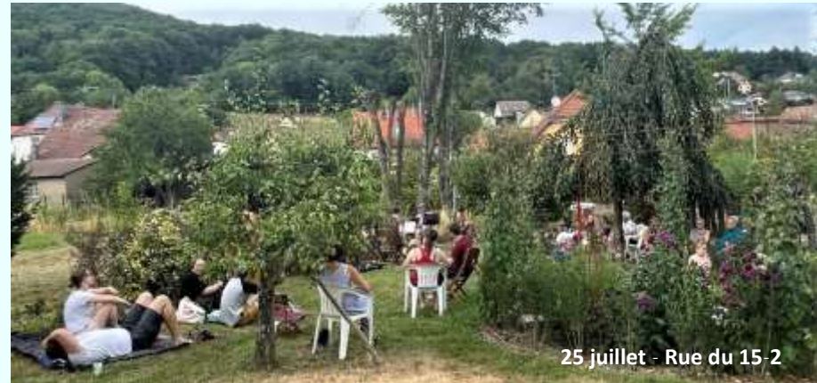
25 juillet - Rue du 15-2

Fête couplée avec la 3 e édition du festival culturel « A cour et à jardin ».