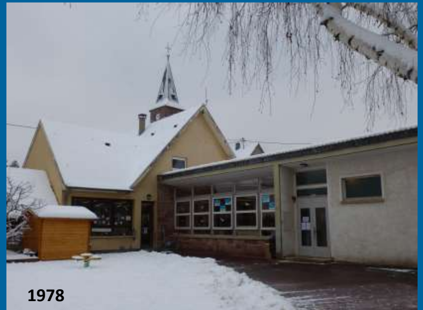
L'ÉCOLE MATERNELLE FÊTE SES 70 ANS