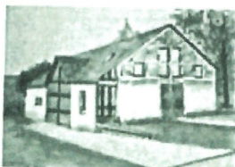
Mairie de Plainval