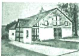
Mairie de Plainval