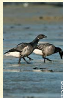
La Bernache cravant

Cette petite oie noire à collier blanc, quitte son pays natal à l'automne pour migrer en France à la recherche d'un climat plus doux et de nourriture. La presqu'île guérandaïse peut accueillir jusqu'à 3 500 individus qui s'alimentent principalement de zostères sur les vasières du littoral. La grande migration de printemps la ramène dans la toundra de Sibérie ou du Groenland pour se reproduire.