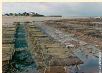
Tables à huîtres

Il est strictement interdit de pêcher dans les parcs et dans la limite de 10 mètres autour des parcs.