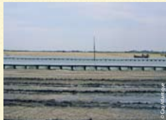
Parc à palourdes ▶

Ces parcs sont identifiés par des rangées de piquets, de tables ou de pieux.