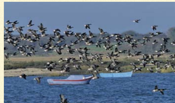
La Bernache cravant est protégée par l'Arrêté Ministériel du 17/04/81