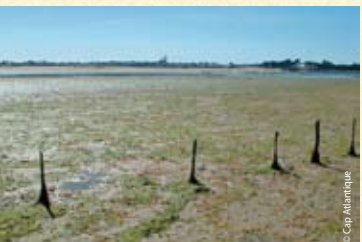
Parc à coques