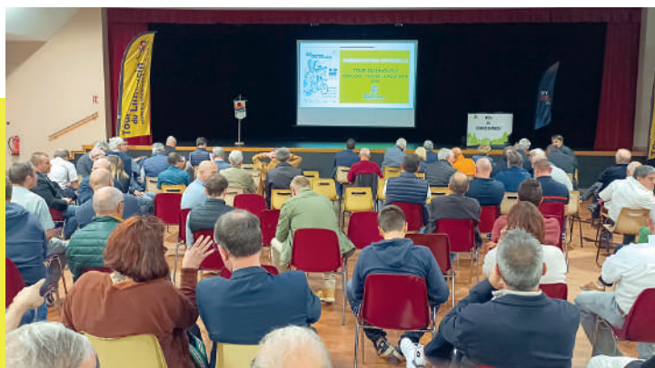
Soirée de présentation du Tour du Limousin