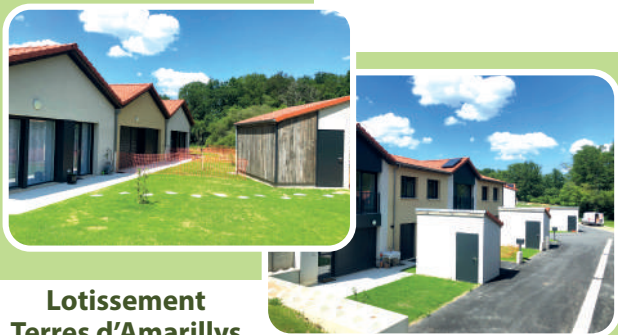
Lotissement Terres d'Amarillys

Ce développement répond à un besoin croissant de logements locatifs sur le territoire, que ce soit de jeunes, de seniors ou de familles, en particulier monoparentales. Le développement des activités économiques dans les zones d'activités proches va également pousser cette demande. Il faut souligner que plus de 60 % des ménages du territoire de Limoges Métropole sont potentiellement éligibles au logement social. L'accès au logement social est lié à un plafond de revenu basé sur le revenu fiscal de l'année N-2 (voir sur www.service-public.fr ).