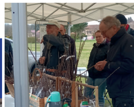
Croqueurs de pommes