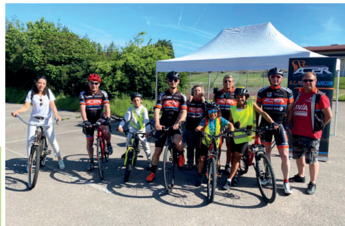
Balade à vélo AC2R