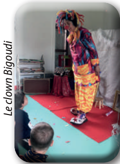
Le clown Bigoudi

Les Ados quant à eux ont été accueillis la première semaine des vacances et ont pu faire un concours jeux de sociétés, un concours de jeux vidéo, une journée « crêpe party » et une sortie à Climb Up (salle d'escalade).