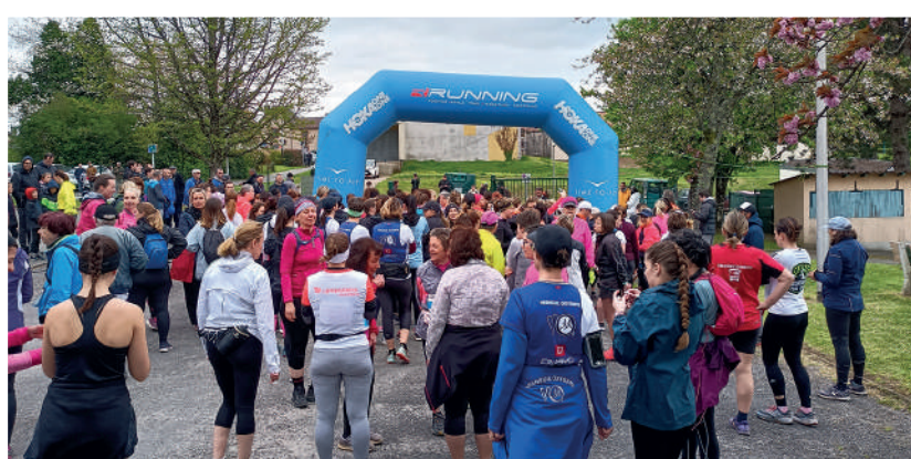
Courses des Gazelles