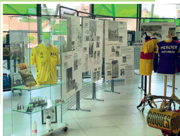
Exposition Raymond POULIDOR (Médiathèque)