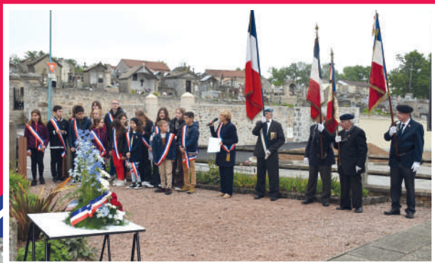
08 Mai 2023