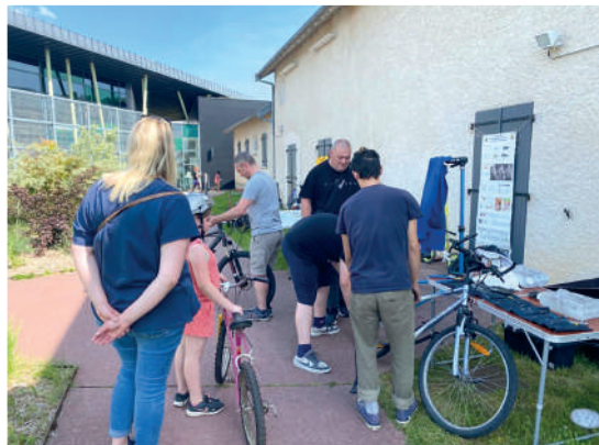
Atelier réparation vélos