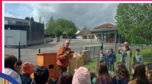
Bienvenue aux poules Neige - Black Panther et Châtaignes