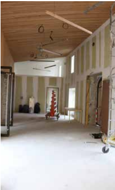
La salle Jeanne d'Arc devrait être livrée au premier semestre 2019.

Chers amis, je vous souhaite pour 2019, une succession de petits bonheurs, des moments de joie familiale, de bonne santé et la réussite de vos projets. ■