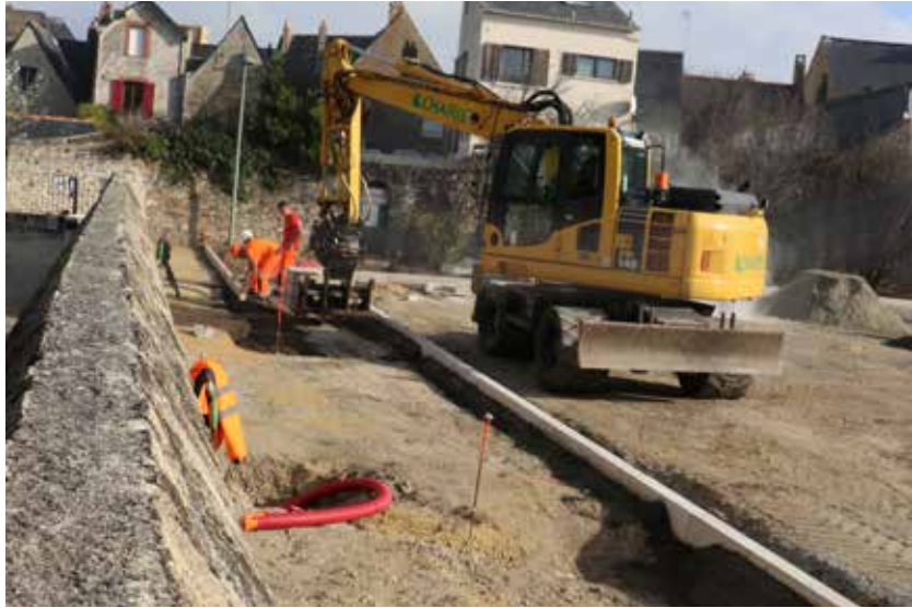
La requalification du quartier de La Ladure devrait être terminée fin 2019.

En effet, la commune représente le service public de proximité. Souvent méconnu, parce qu'évident, trop peut-être, le quotidien est au centre du travail de fournis que font ensemble, élus et services. Faire vivre la commune, œuvrer dans l'intérêt de chacun, rendre service, c'est notre mission principale. Pour illustrer mon propos, je vais m'appuyer sur le succès de la Médiathèque qui ne repose pas que sur la qualité architecturale et sur son