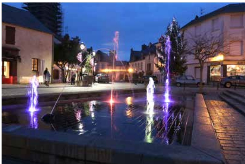
La fontaine sèche illumine la place Donatien-Lepré.