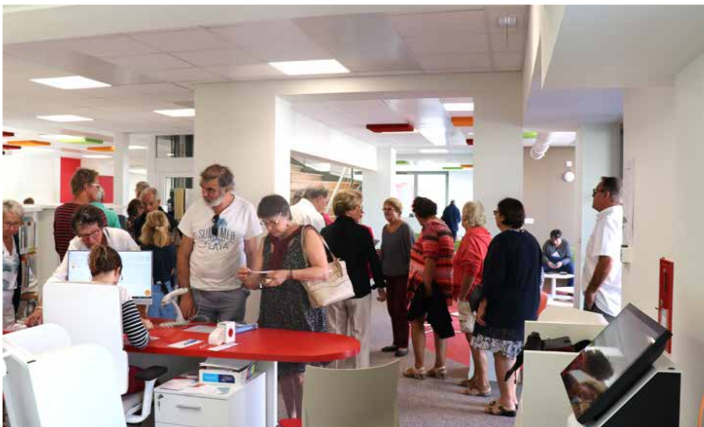
La médiathèque a ouvert le dimanche 2 septembre après 14 mois de travaux. Un public de curieux et de lecteurs était présent pour s'emparer des lieux.

Lors d'une inauguration, un ancien préfet de région rappelait qu'une médiathèque était un des lieux susceptibles de répondre le mieux à la devise républicaine « Liberté, égalité, fraternité ». ■