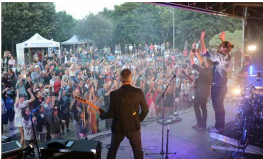
Epsilon - 26 juillet 2018.

De la pop, du rock aux couleurs celtiques, de la folk, et des reprises de musiques actuelles, tel était le programme des concerts de Mont-Esprit. Pour la 3 e année consécutive, ce rendez-vous de plein air a conquis son public. ■