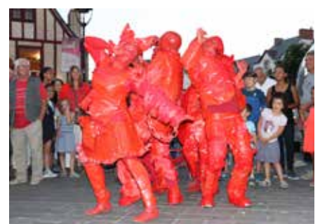
Maboul Distorsion - 23 juillet 2018.