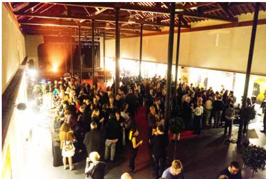
Soirée de clôture du Festival du Film du Croisic De la Page à l'Image 2016.

La fréquentation doit être au cœur de nos réflexions, avec l'exploitation d'un ou deux autres sites pour multiplier les projections. ■