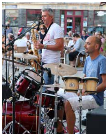
Blue Lobster - 9 juillet 2018.