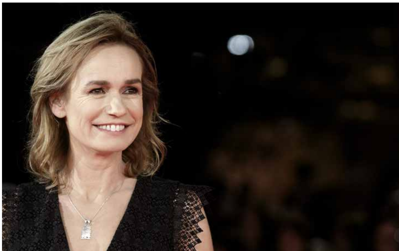
Sandrine Bonnaire, révélée au grand public dans « À nos amours » de Maurice Pialat à recevoir un Chabrol d'Or.

« Le Festival du Film du Croisic est un Festival épatant », et ça tombe bien, car ce mot, « épatant », était l'adjectif préféré de Claude Chabrol. ■