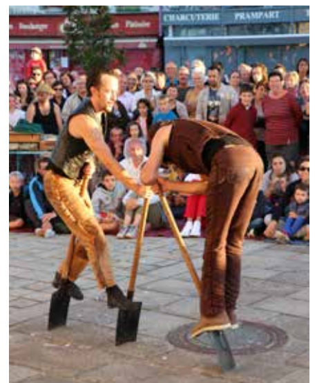
Gum Over - 16 juillet 2018.