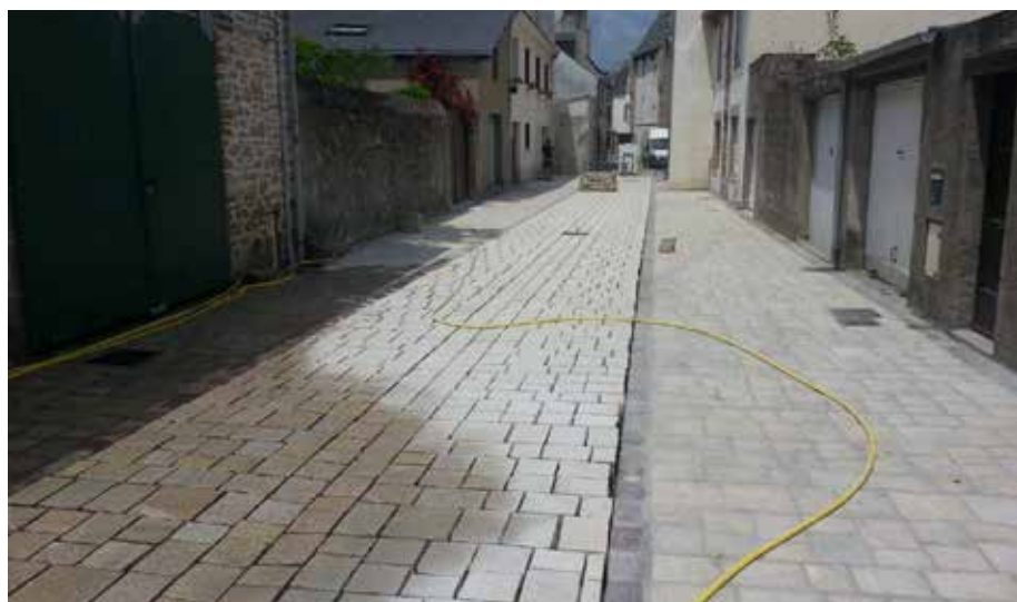
La rue Jean-Jacques-Rousseau et la rue Jules-Ferry seront aménagées sur le principe de la rue Saint-Yves.