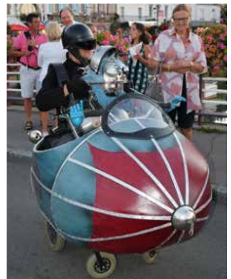
Les Argonautes - 9 juillet 2018.