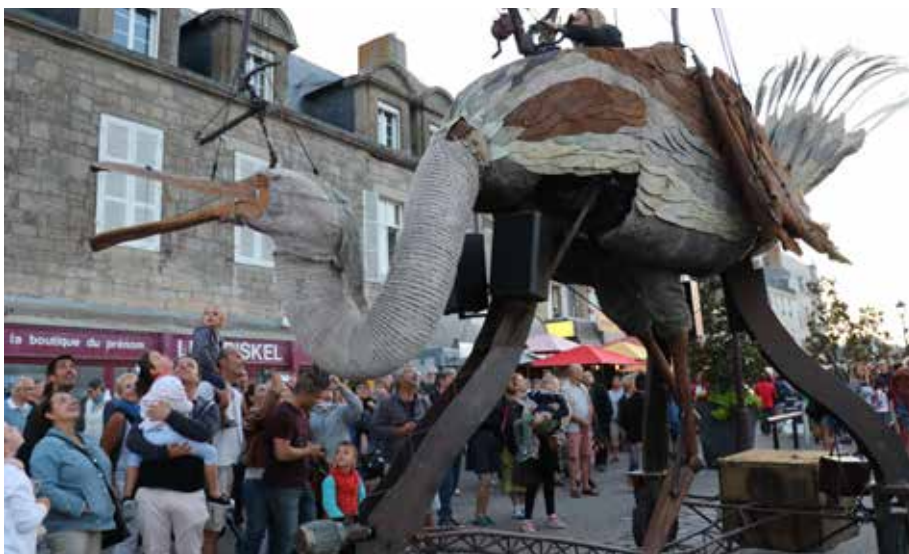
Oisôh - 30 juillet 2018.

Animation phare des soirées estivales de début de semaine, Un soir sur les quais est une manifestation dont la réputation n'est plus à faire et dont le succès ne se dément pas. ■