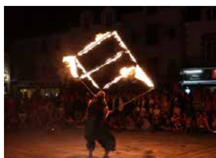
CHK1 - 23 juillet 2018.