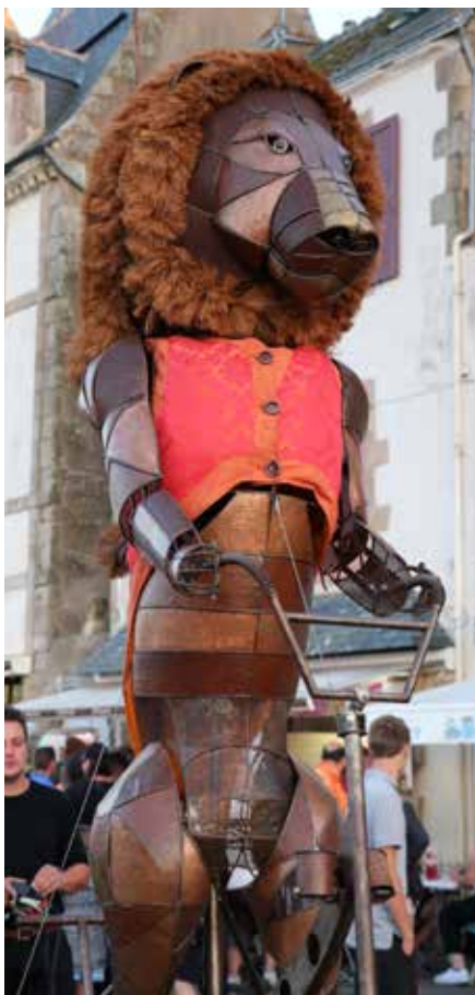
Le Lion - 23 juillet 2018.