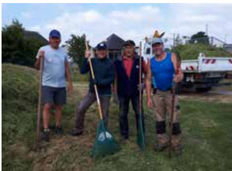
P. 21 Matinée citoyenne à Trélivan