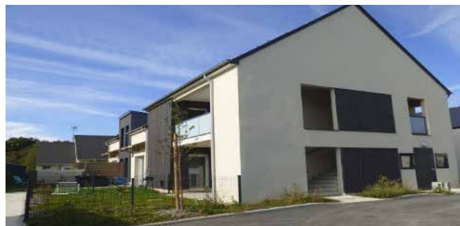
Le bois de Linache (4 logements)