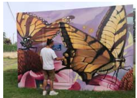
P. 24 Des papillons au Rocher