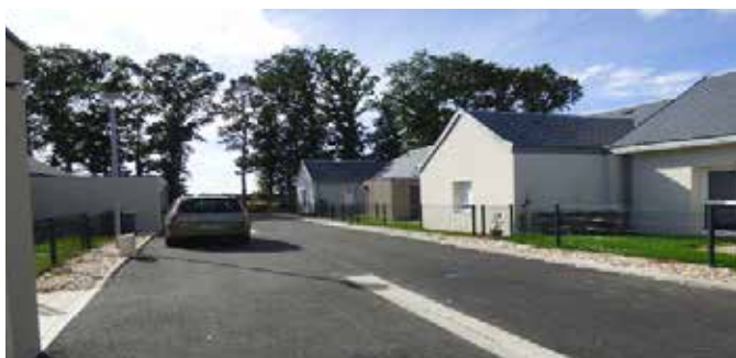
Le Petit Bois, rue Victor Hugo (10 logements)