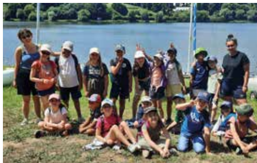
P. 23 Accueil de Loisirs