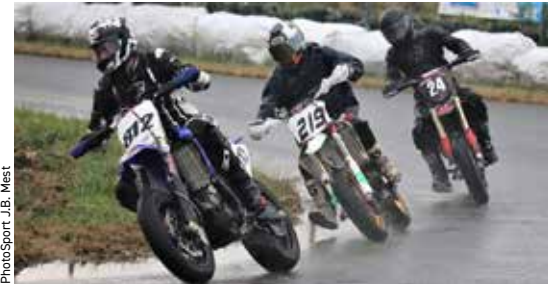
PhotoSport J.B. West

Toutes les idées sont les bienvenues, il suffit de nous contacter pour en parler, soit sur la page Facebook A.S Trélivan