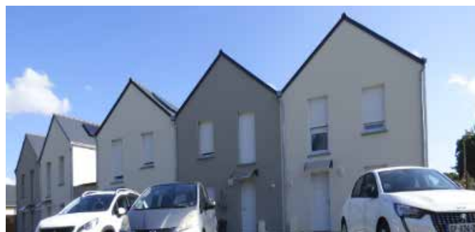
10 bis rue des Clairettes (5 logements)

Nous souhaitons la bienvenue aux nouveaux habitants.