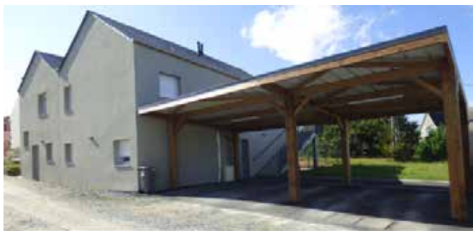
Résidence du Drouet (3 logements )