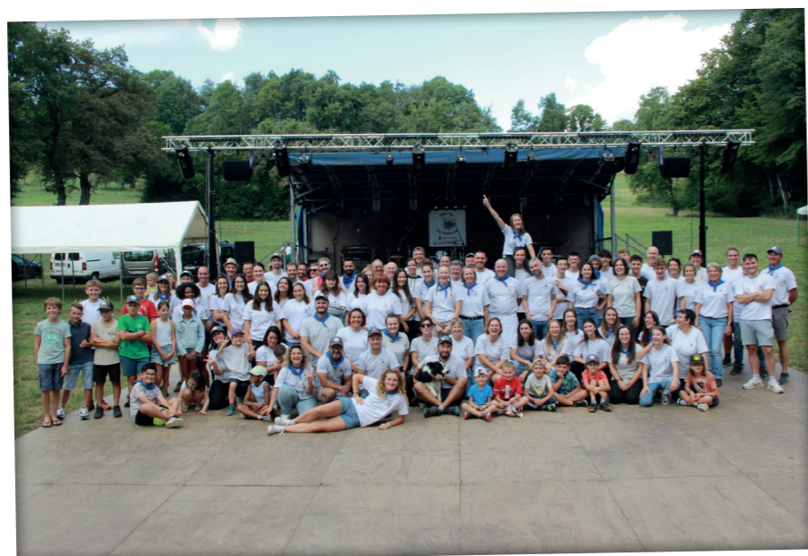
Des bénévoles de plus en plus nombreux pour organiser la 5 e Fête de la Batteuse

fermedesoursons@orange.fr - 06 11 21 25 73