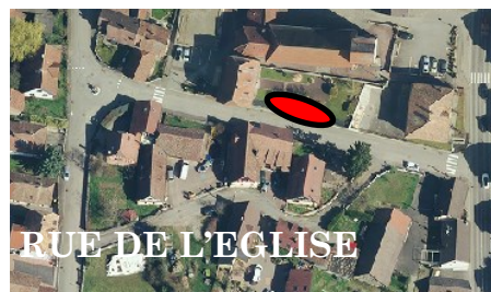
RUE DE L'EGLISE