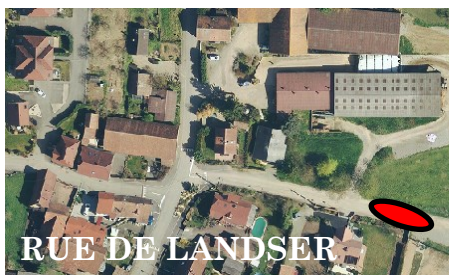
RUE DE LANDSER