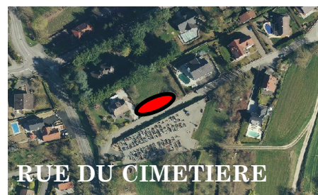
RUE DU CIMETIERE