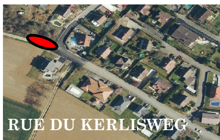
RUE DU KERLISWEG