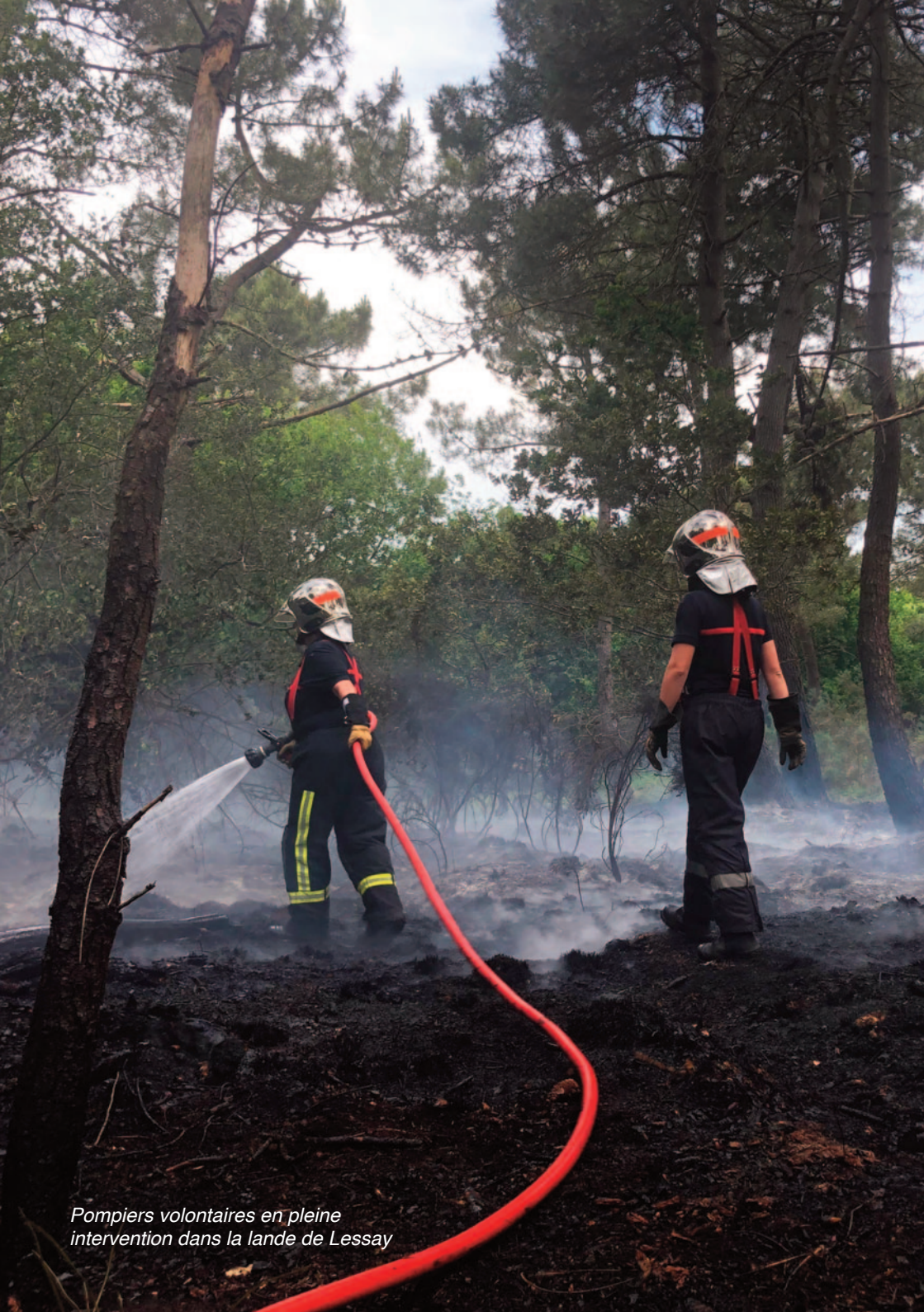
Pompiers volontaires en pleine intervention dans la lande de Lessay