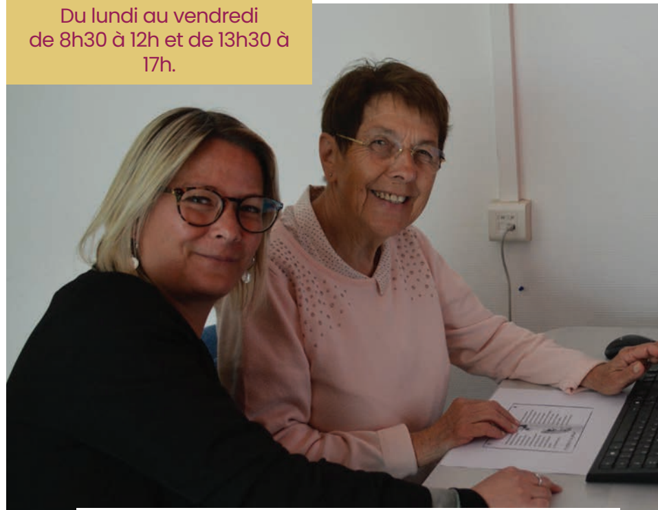
Des ateliers d'initiation à l'informatique sont proposés aux seniors

● Le CCAS gère les dossiers de demande de médailles de la famille française . Ces distinctions s'adressent aux mères de famille ayant élevé au moins quatre enfants. Les demandes sont à déposer jusqu'au 31 décembre .