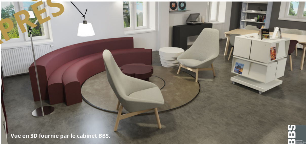
Vue en 3D fournie par le cabinet BBS.

Les travaux s'étaleront sur plusieurs mois. Adieu la vieille moquette ! Les sols vont être changés au rez-de-chaussée et à l'Espace jeunesse, au profit de sols vinyles résistants. Un nouveau mobilier sera mis en place pour remplacer celui qui a plus de 30 ans.