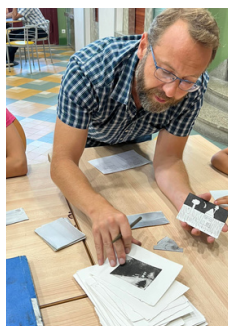
Un atelier linogravure.