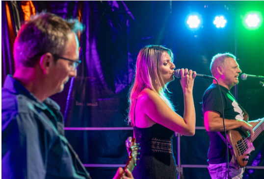
Le groupe Cache-cache, 100% années 80.

Organisés par la Ville en partenariat avec l'OMSC (Office municipal des sports et de la culture) et les associations locales, les concerts du vendredi soir aux Jardins du Monde ont fait un carton plein chaque semaine !