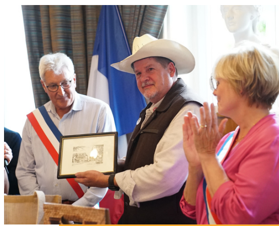
Aujourd'hui il n'y a plus qu'une dizaine d'habitants qui parle encore l'alsacien. On y a maintenu certains aspects du folklore tels que la danse, les costumes et certaines fêtes.

On retrouvait parmi ces Wittelsheimois qui avaient émigré à Castroville des Bader, des Haegele, des Schott, des Zinsmeyer, des Rohrbach, des Burger, des Meyer... Les Solltner, les Kauffmann, les Jegly, les Heguele... Bader et Hegele faisaient partie des fondateurs.