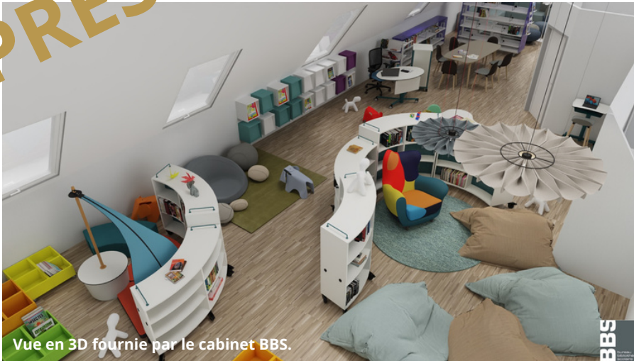
Vue en 3D fournie par le cabinet BBS.