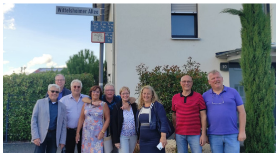
Ci-dessus, devant l'allée de Wittelsheim à Bürstadt.