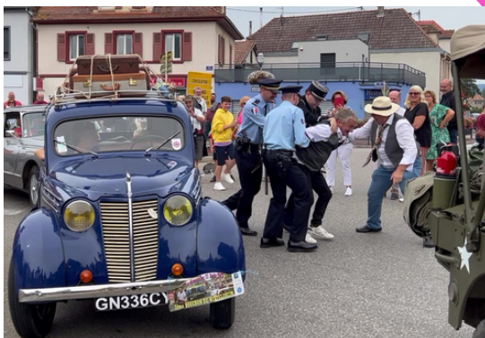
L'association Police d'antan d'Alsace a elle aussi assuré le spectacle !