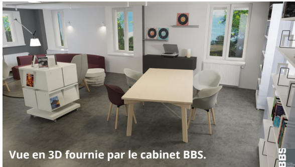
Vue en 3D.

Ci-contre et ci-dessous, des vues en 3D de l'espace jeunesse et de l'espace adulte avec le futur mobilier.