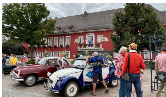
Un retour de vacances attendu avec impatience !