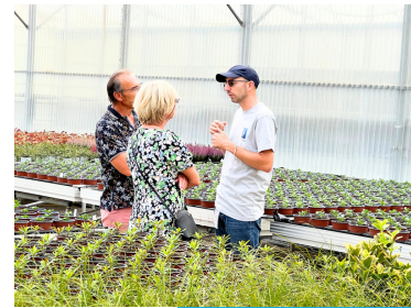
Les agents du Service Environnement ont répondu à des questions des habitants sur le choix des essences.