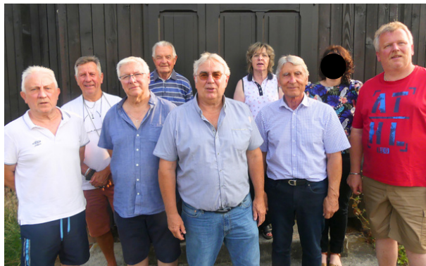
Les membres du conseil d'administration de l'association pour la restauration du patrimoine historique et culturel de Wittelsheim.

mécénat et espère réunir les 50 000 € destinés à la reconstitution de la statue et de sa pose.