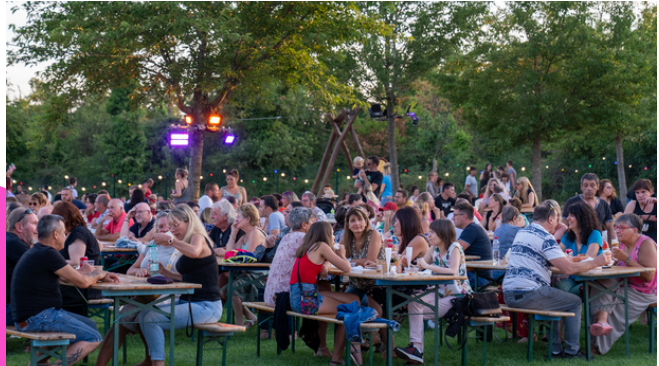
Buvette et restauration étaient assurées tous les vendredis.