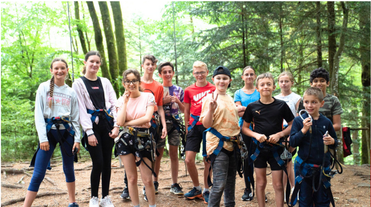
Pas le temps de s'ennuyer cet été !

Escalade, escrime, golf, paddle, spéléologie, pêche, VTT ou encore taekwondo, il y avait l'embaras du choix parmi les activités proposées par le Service des Sports de la ville dans le cadre de l'Académie des Sports Été. De belles découvertes et d'heureux souvenirs pour tous !