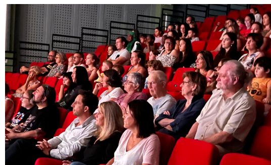
Un spectacle jeunesse à la salle Grassefert.