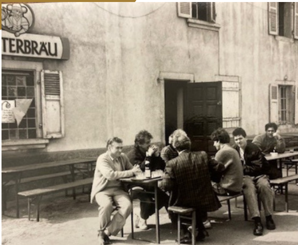
Bâtiment réputé être l'un des plus anciens de Wittelsheim, sa construction est estimée au XVIe s.

En 1892, Eugène Sigrist acquit le bâtiment pour y installer l'auberge/boulangerie Aux deux clefs . Deux maires, François Antoine puis son fils Jean-Baptiste y vécurent au XIXe siècle. Puis la commune de Wittelsheim l'acheta en 1981 pour y installer la bibliothèque municipale puis l'école de musique. Des travaux de rénovation ont duré de 1981 à 1993 et la bibliothèque fut ouverte le 9 avril 1992. L'adhésion y coûtait alors 30 francs et 4 000 ouvrages y étaient conservés (25 000 aujourd'hui).