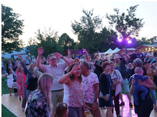
Entre blind test karaoké, hip hop et soirées années 80, il y en avait pour tous les goûts !