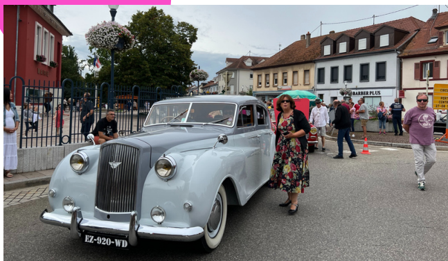
Un défilé organisé avec avec la participation du Club des véhicules anciens de Mulhouse.