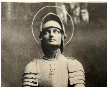
L'Alsace étant redevenue allemande, le Kreisleiter de Thann a demandé au curé de faire enlever la statue de Jeanne d'Arc en 1940.