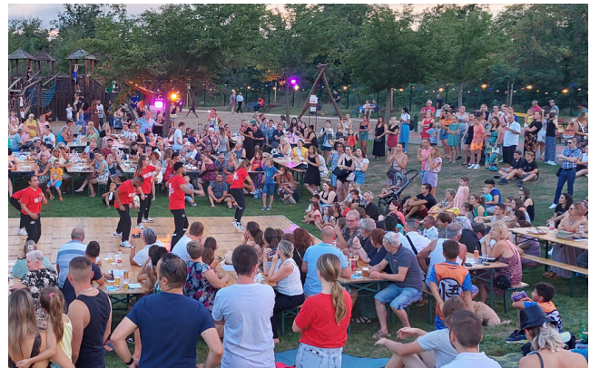
Place à la danse !