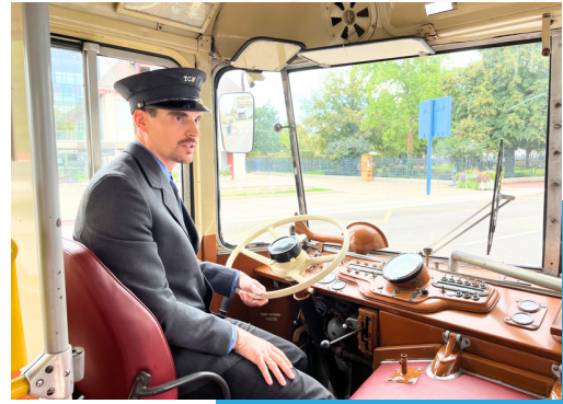
Une navette historique et gratuite, le bus de collection de Soléa, desservait tous les lieux d'ouverture au public.