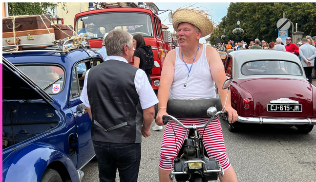
Un adjoint qui s'investit à fond !