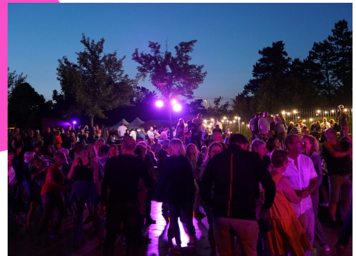
De quoi s'amuser... jusqu'au bout de la nuit !