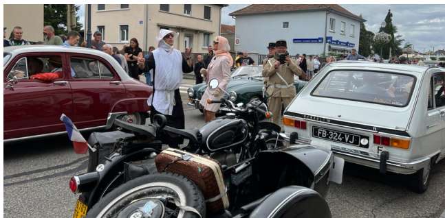
Wittelsheim sur la route des vacances, qui l'eût cru ?