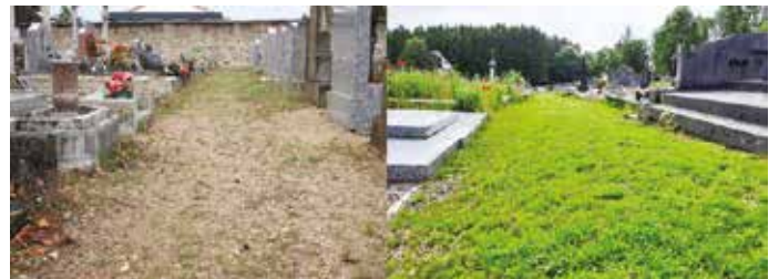
Début de l'engazonnage

Pour plus d'informations complémentaires vous pouvez contacter la mairie.