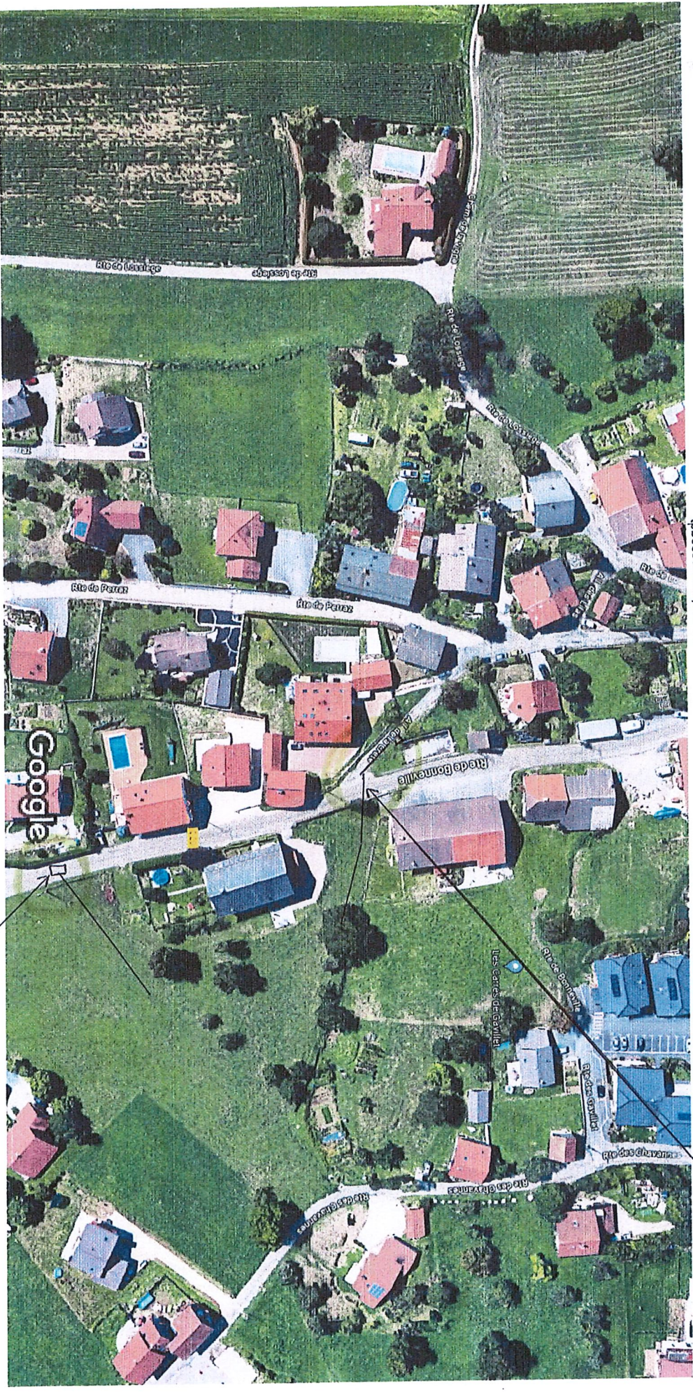
Images ©2023 Google, Images ©2023 CNES / Airbus, Maxar Technologies, Données cartographiques ©2023 20 m

accès sur guille existant réseau eau prioritaire