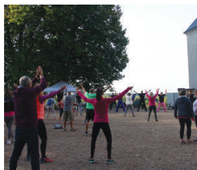
Fight Club 37