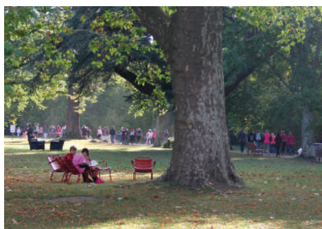
Départ de randonnée