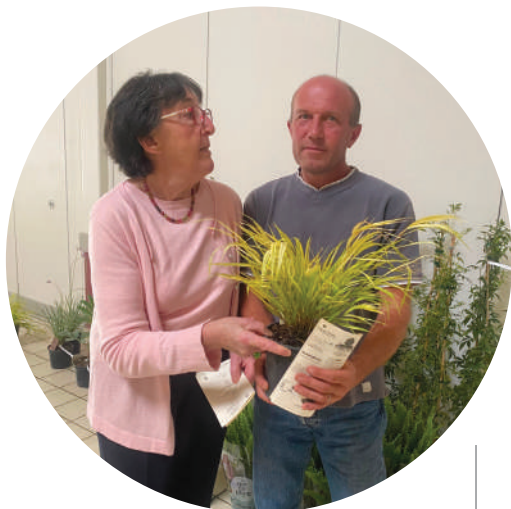
Remise de prix à l'agent du service des espaces verts.