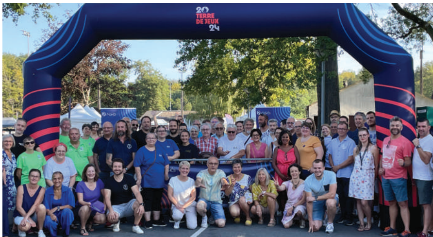
Élus, associations, bénévoles et agents municipaux à la Journée des associations

L'année 2024 s'annonce déjà riche en événements. Le projet Monts, Terre de Jeux 2024 prévoit une série de mani-