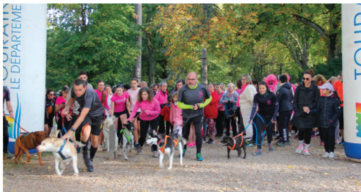
Départ de la course des Roses