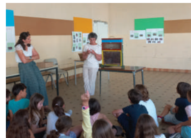
École Pierre et Marie Curie (CP/CE1, CE2 et CM1)