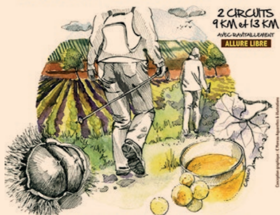
CHÂTAIGNES GRILLÉES ET VIN NOUVEAU À L'ARRIVÉE