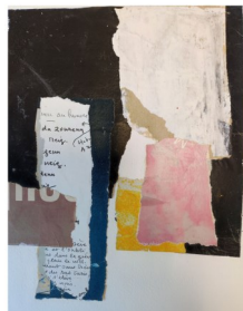
Atelier Incognito Exposition peintures