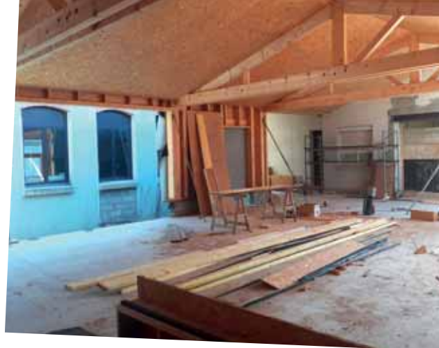
Future salle des mariages et du conseil