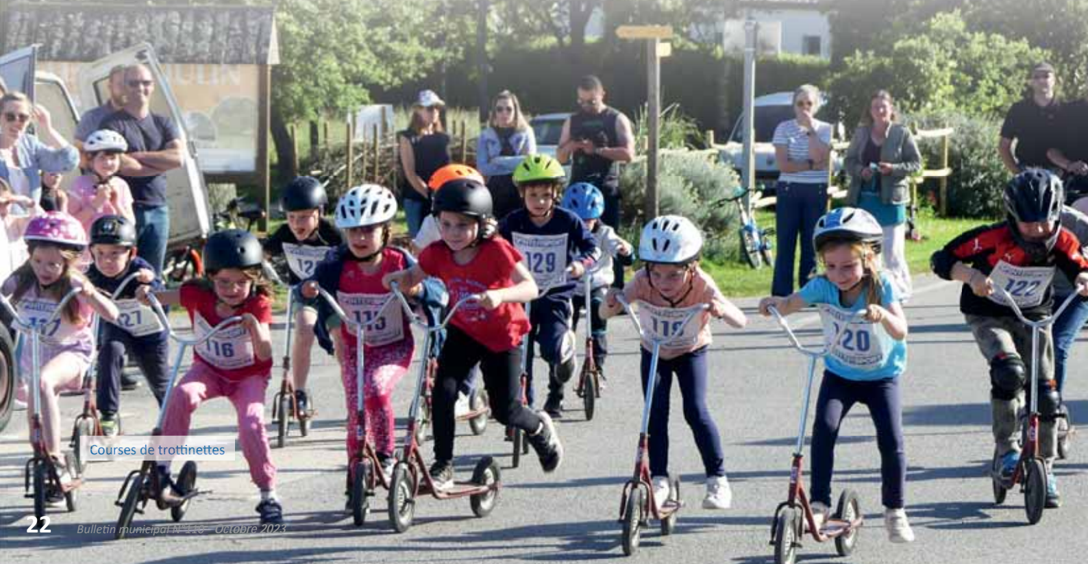
Courses de trottinettes

Voilà ! Si ça vous dit de nous rejoindre, n'hésitez pas à venir faire la fête avec nous !