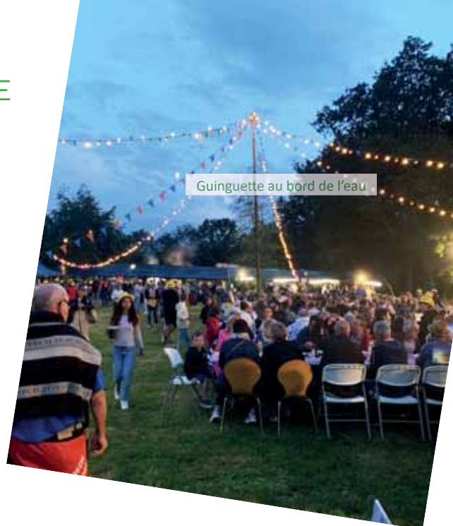
Guinguette au bord de l'eau

L'année s'est poursuivie par l'organisation de la célèbre « Guinguette au bord de l'eau ». Malgré une belle averse dans la soirée, les personnes venues nombreuses sont restées en se protégeant sous les chapiteaux, des parapluies et même des parasols.