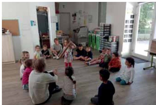
Photo souvenir des répétitions de l'an dernier