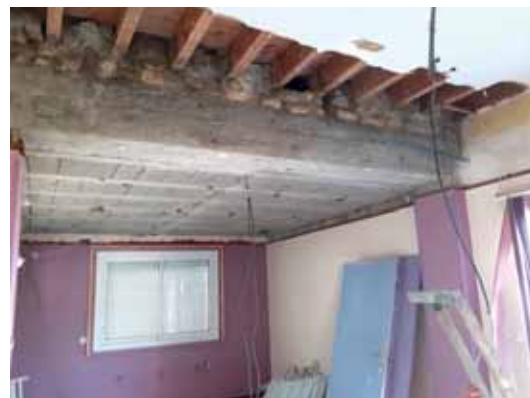
Ancienne salle du conseil

L'ensemble du personnel technique, scolaire, animation et administratif a été formé aux premiers secours les 1 er et 26 septembre derniers.