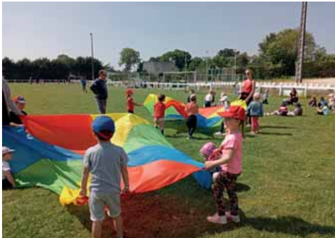
Olympuces 26 mai 2023