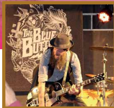
P.33 LOSTENK FEST