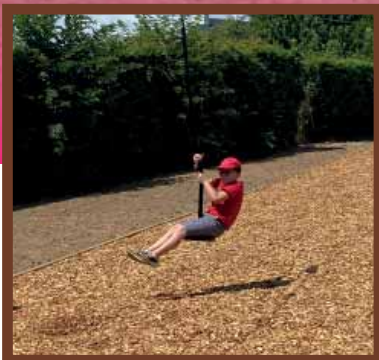
P.05 BUDGET PARTICIPATIF