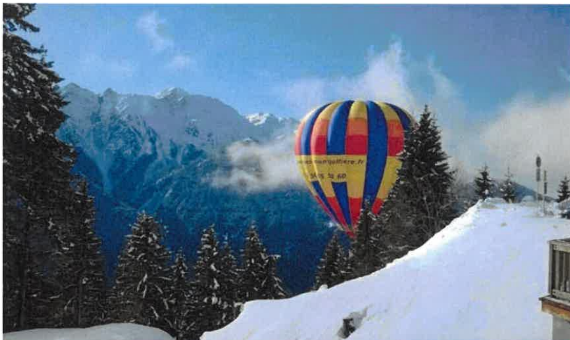
Photo de couverture : Montgolfière à Bisanne - Beaufortain - Photo libre de droit