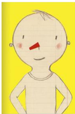
Ding dang dong de Frédérique Bertrand.

Heure du conte : le mercredi 25 octobre à 16 h : « les visages : promenade en histoires... et en dessins ! »