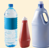
Bouteilles & flacons