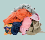
Textiles, linges, chaussures