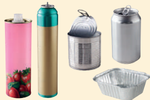
Bouteilles • Aérosols alimentaires / d'hygiène • Conserves • Canettes