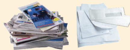
Journaux, publicités, enveloppes...