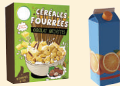
Cartonnettes • Briques alimentaires