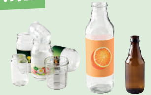
Pots, bocaux • Bouteilles