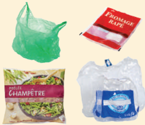
Sacs, sachets, films