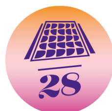
Pyramide d'Eden La Grande-Motte