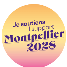
Je soutiens Montpellier 2028