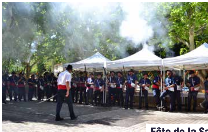
Fête de la Saint-Étienne