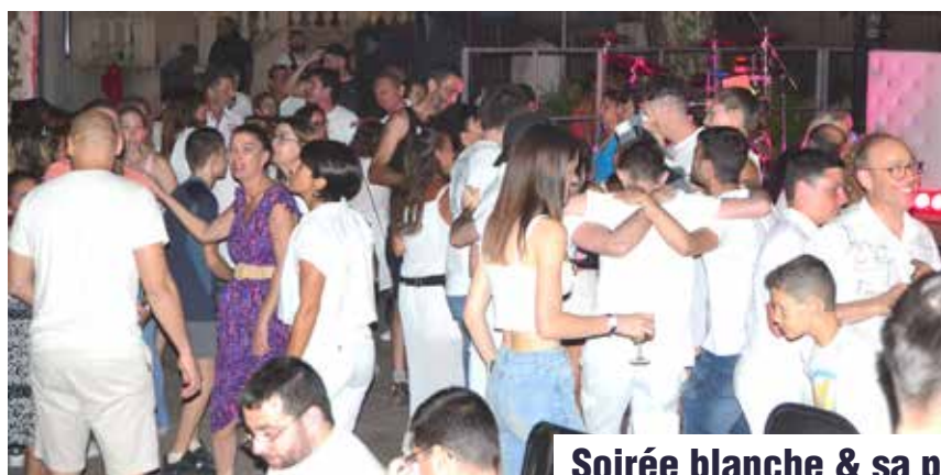
Soirée blanche & sa paëlla