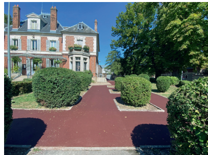
Création d'un enrobé sur le côté de la mairie