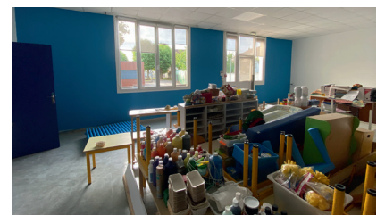
Peintures de classe à Saint EXUPÉRY