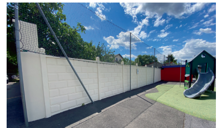
Reprise en peinture du mur de la cour de la maternelle Saint EXUPÉRY