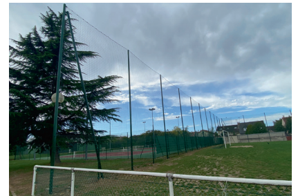
Installation d'un pare-ballon de 8 m entre le stade annexe et les courts de tennis