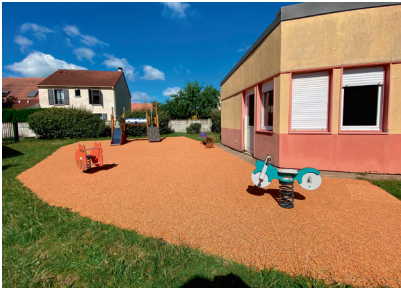
Installation de nouveaux jeux et de bancs, reprise du sol souple à l'Accueil de Loisirs du groupe scolaire Fontaine CORNAILLE

La ville profite de l'été, période de vacances pour les enfants, pour effectuer des travaux dans les bâtiments communaux : écoles, équipements sportifs et de loisirs... Voici les réalisations effectuées en juillet/Août :