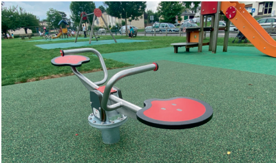
Nouveau jeu au Parc St Bruno