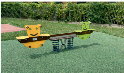
Remplacement d'un jeu Place du Général De GAULLE devant l'école maternelle Saint EXUPÉRY