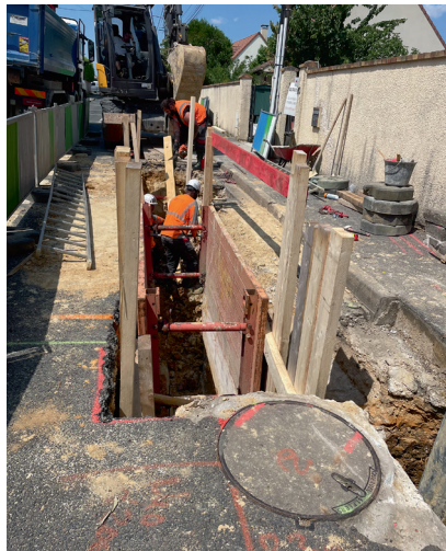
Le SyAGE a procédé au renouvellement de canalisations d'assainissement rue de la Brèche des Vignes et rue de la Fontaine Segrain.