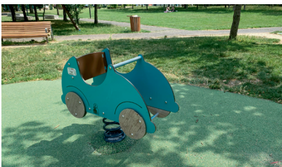
Remplacement d'un jeu Parc de la Maison Verte