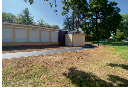
Création d'un cheminement piétons autour de la maternelle Fontaine CORNAILLE