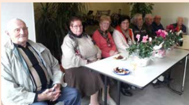
Les récipiendaires 2023