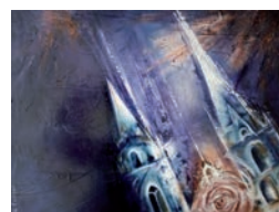
Cathédrale (C. FAVIER)