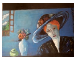
Femme au bouquet (F.LAILLET)