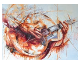
Guitariste (P. AUBRY)