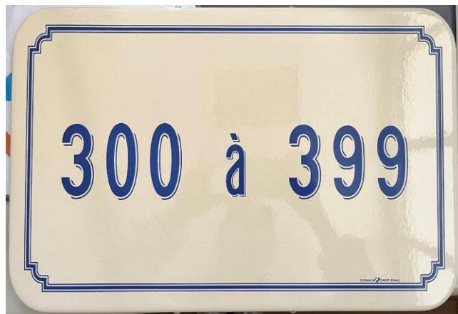
Panneau d'indication à l'entrée des rues

Les courriers demandant aux habitants de venir chercher leur numéro à la mairie seront distribués prochainement par les conseillers.