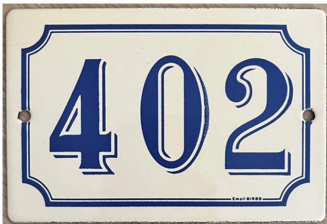
Panneau pour chaque habitation