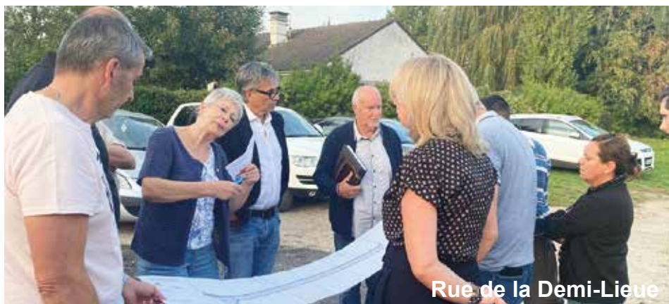
Rue de la Demi-Lieue