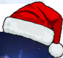
Village de Noël