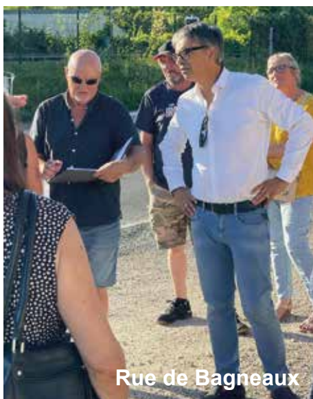
Rue de Bagneaux

Mercredi 11 octobre, une réunion de quartier a eu lieu rue de la Demi-Lieue, afin de répondre aux questions des habitants concernant les importants travaux de cette rue.