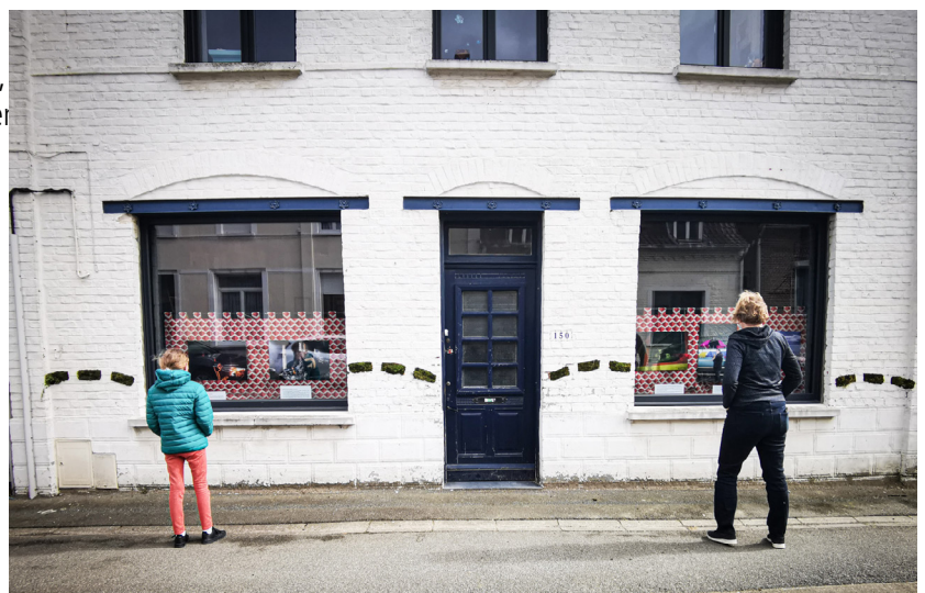
Dessin : Isabelle SERRO