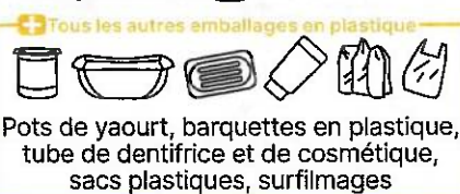
Tous les autres emballages en plastique