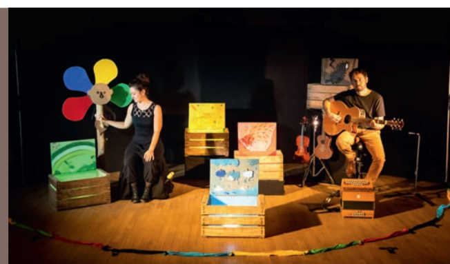
Bibliothèque Page 6