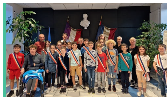
Bienvenue au CME Page 10