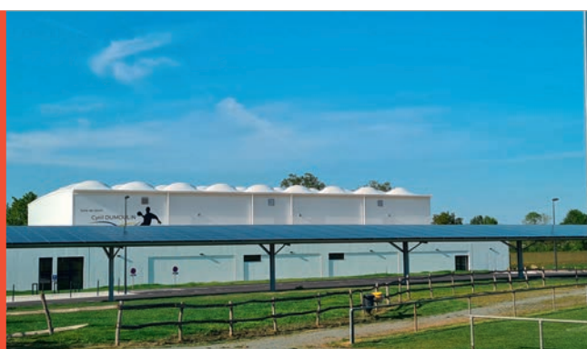
3 ans à votre service Page 4

MERCREDI 10 JANVIER 2024 À 19H SALLE DU MOULIN ROUGE