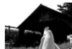
Le grand lavoir