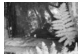
Le lavoir de l'Abbaye d'en haut