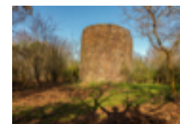
Moulin de Rohan