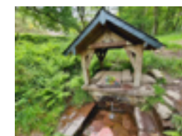
La Fontaine Ste Apolline