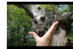
Le Châtaignier du Pas aux biches