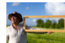
Vers la Ville André