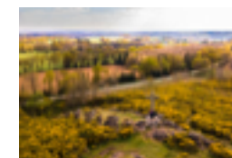
La Croix Ste Anne