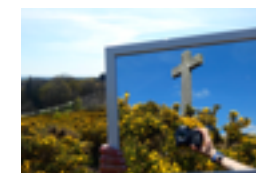
La Croix Ste Anne