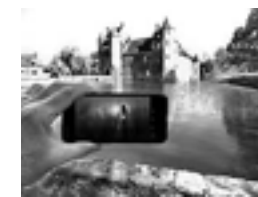
Le Château de Trécesson