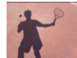
Le terrain de tennis