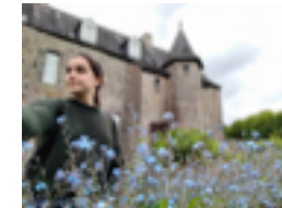
Le Château de Trécesson