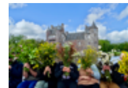
Le Château de Trécesson