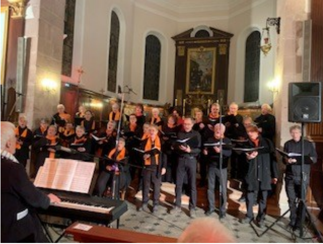
Cecilia's Swing le 26.11.2023