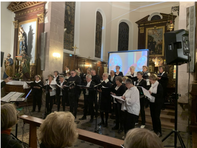
Not en chœur le 12.11.2023

Le deuxième week-end la chorale Not en Chœur a fait vibrer un public venu nombreux au travers d'un répertoire contemporain ouvert à tous les courants musicaux, avec des messages de paix et de tolérance adressés à l'ensemble des dirigeants de ce monde.