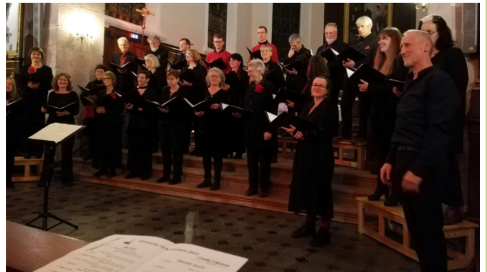
Vocaleidos le 19.11.2023

Pour commencer la chorale Gospel's rejoicing a ouvert les festivités le dimanche 5 novembre, « Liberté, Espoir de Paix et Tolérance » tel sont les messages du Chœur qui chante l'histoire, les émotions, les joies et les souffrances au travers de chants Afro-Américains et de Spirituals.