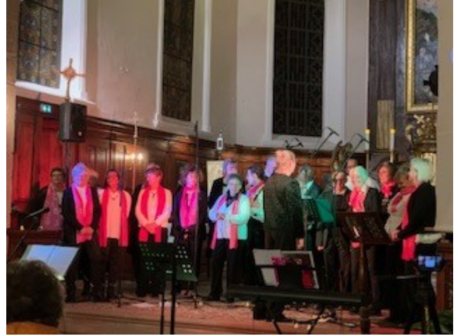
Gospel's rejoicing le 5.11.2023

Comme de coutume, l'association du clocher vrillé de Niedermorschwihr présente les dimanches du mois de novembre un ensemble de concerts variés en l'église Saint Gall.