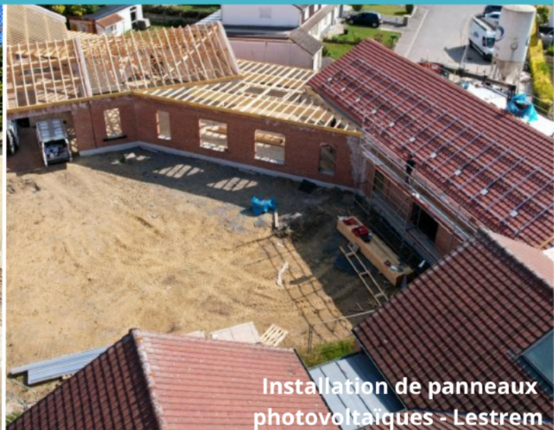
Installation de panneaux photovoltaïques - Lestrem