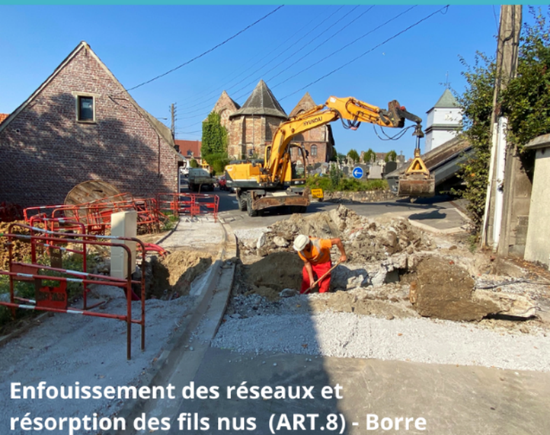
Enfouissement des réseaux et résorption des fils nus (ART.8) - Borre