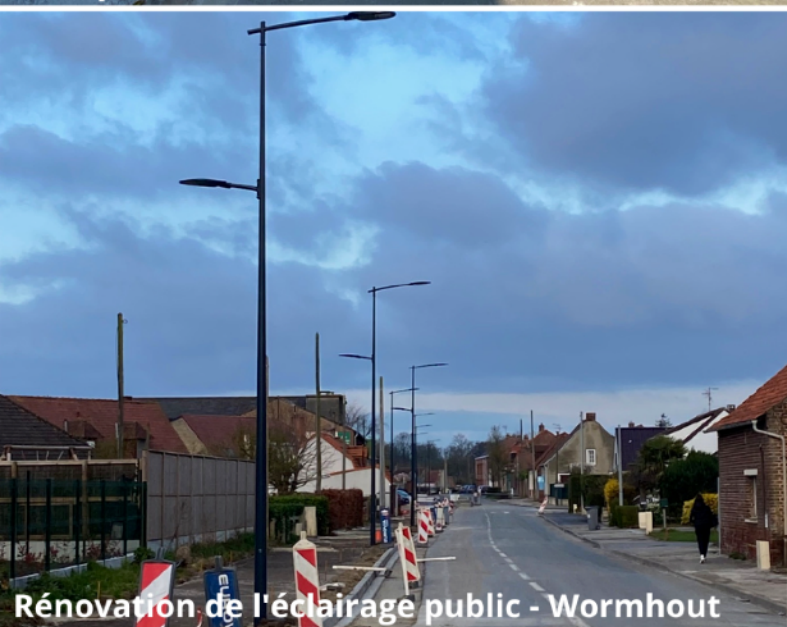
Rénovation de l'éclairage public - Wormhout