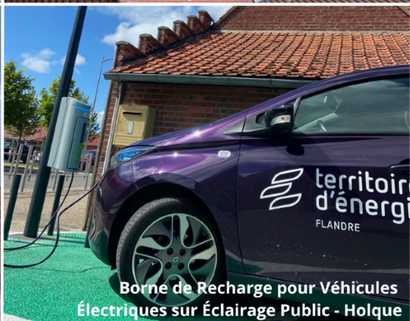
Borne de Recharge pour Véhicules Électriques sur Éclairage Public - Holque