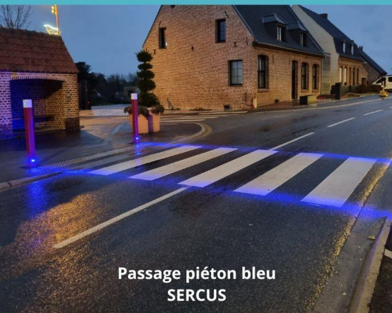
Passage piéton bleu SERCUS