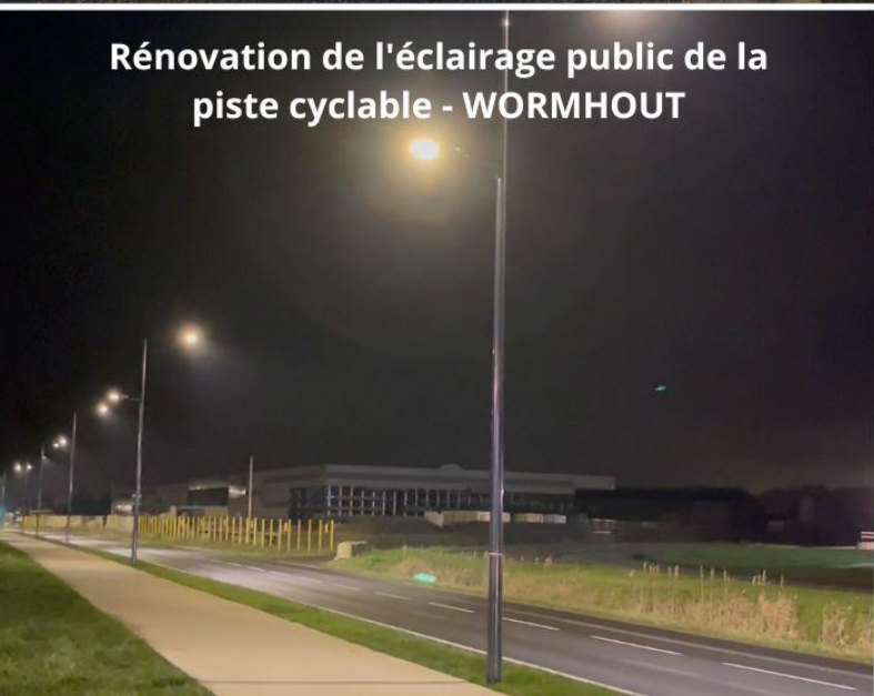
Rénovation de l'éclairage public de la piste cyclable - WORMHOUT