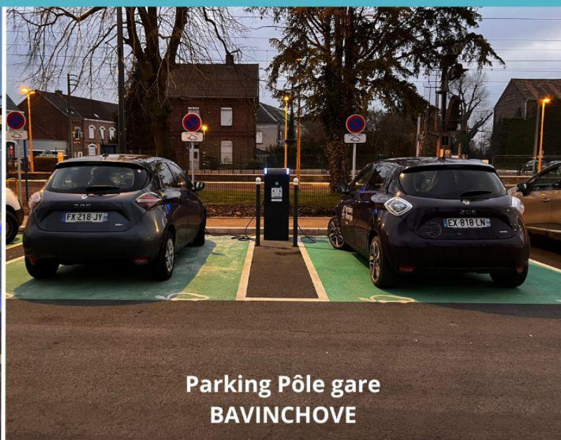
Parking Pôle gare BAVINCHOVE