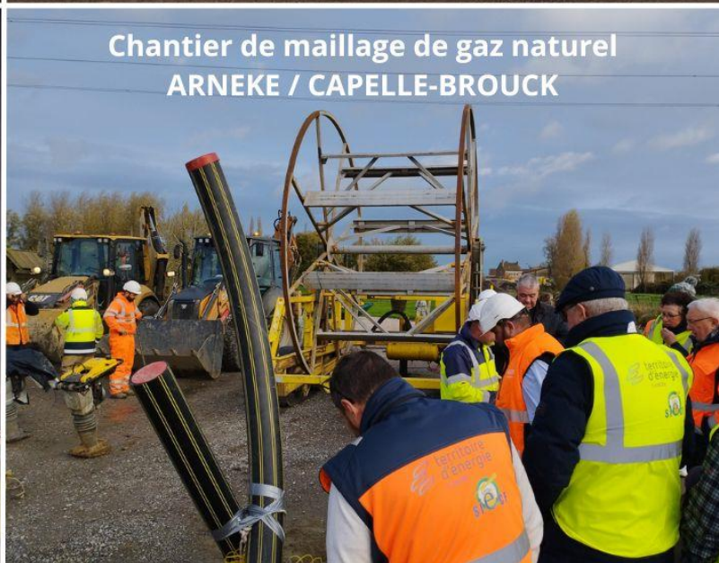
Chantier de maillage de gaz naturel ARNEKE / CAPELLE-BROUCK