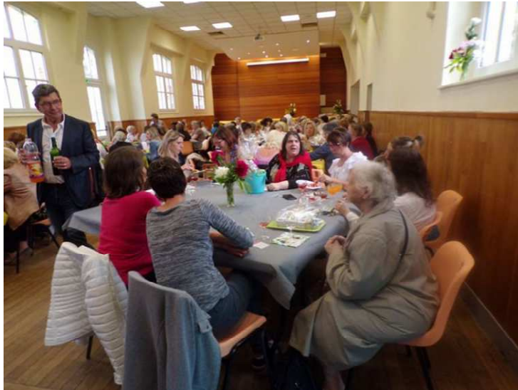
Cocktail de la Fête des Mères

Pour rappel, le bureau du CCAS est composé de 7 membres élus et de 6 membres représentant des associations et volontaires. Le Maire est désigné d'office Président. Les membres se réunissent 3 à 4 fois par an. Le CCAS a son propre budget et décide des aides, animations et activités qu'il souhaite organiser.