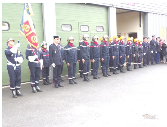
Les membres du CIS et de son école