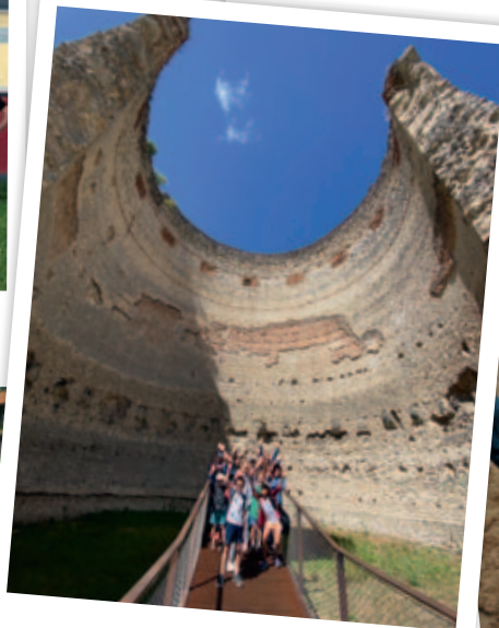
Visite à Vésunna