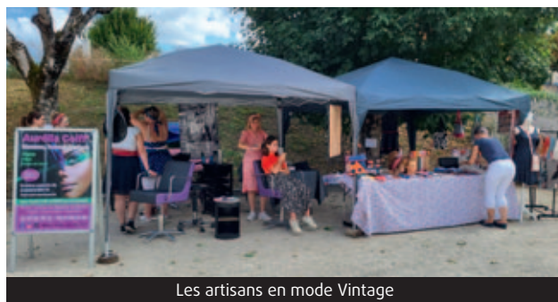
Les artisans en mode Vintage