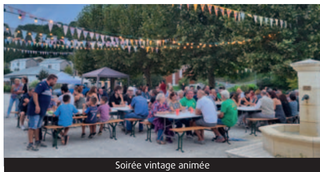
Soirée vintage animée