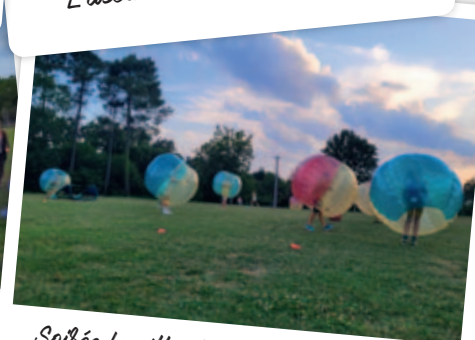
Soirée famille et ados bubble bump