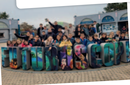
Séjour la tête dans les étoiles