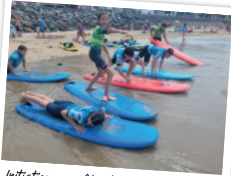
Initiation au surf sur les plages du Pays Basque

Tout au long de l'année, les animateurs du centre de loisirs se démènent pour organiser des activités toujours plus proches des centres d'intérêts des jeunes : sports en tous genres, découverte du patrimoine, ... permettant ainsi de créer des liens forts.