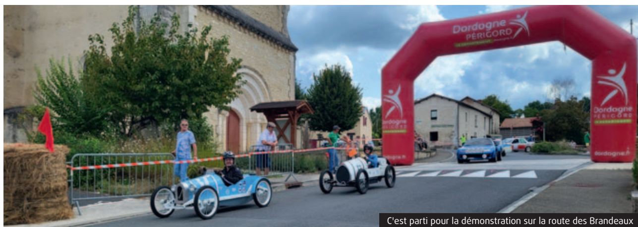
C'est parti pour la démonstration sur la route des Brandeaux

Sur la place de la mairie, les véhicules anciens se sont positionnés avant de partir pour une démonstration sur la route des Brandeaux. Les pilotes des voitures 1900 à 1985 et des motos 1900 à 1970, ont pu défilé durant deux jours sous les applaudissements des spectateurs rassemblés dans le bourg ou dans le champ transformé en camp militaire. La soirée du samedi s'est clôturée par un repas dansant pour le plus grand plaisir des danseurs de rockabilly !