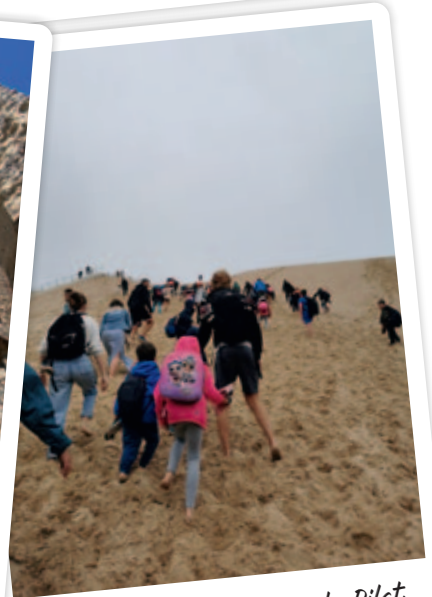
L'ascension de la Dune du Pilat