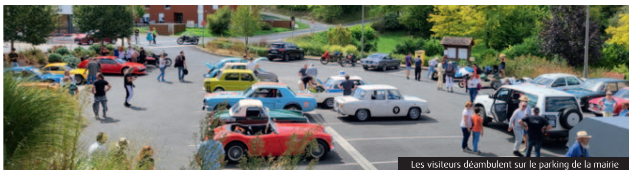
Les visiteurs déambulent sur le parking de la mairie