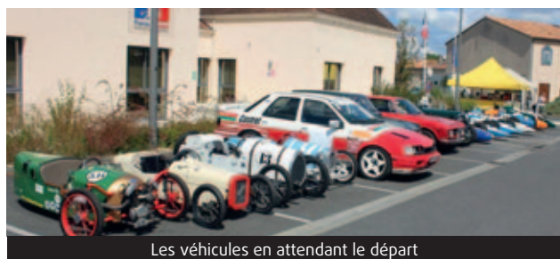
Les véhicules en attendant le départ