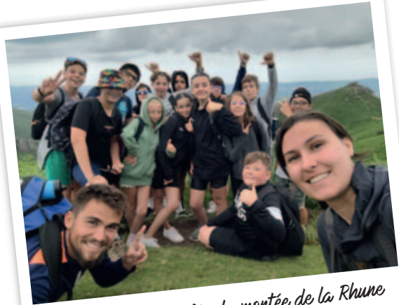
La satisfaction après la montée de la Rhune