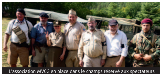
L'association MVCG en place dans le champs réservé aux spectateurs