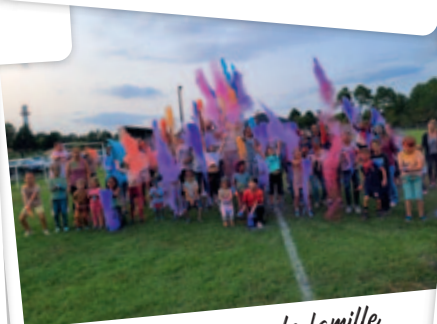
Soirée Run Color avec la famille et les copains