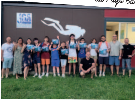
Un diplôme de plongée bien mérité