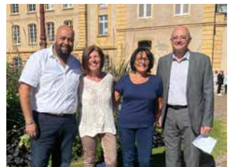
Photo prise lors du vote aux élections sénatoriales 2023 pour un candidat porteur de nos valeurs.

Nous souhaitons à toutes et tous les Rombasiens de vivre de joyeuses fêtes de Noël.