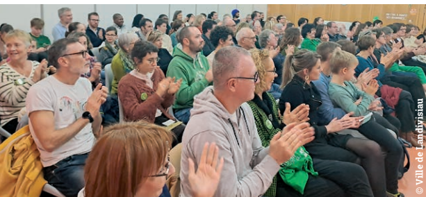
Une inauguration pétillante

De belles rencontres, des sourires et des rires en pagaille, beaucoup d'émotion aussi. Le malicieux "Moi les Mots nous rend plus beau" pourrait être le slogan complice qu'on porterait dans toute la Ville pendant ces 5 jours. Un "excellent cru", "inoubliable", tant pour les auteurs et illustrateurs invités que pour le public, venu de loin (Vendée, Loire-Atlantique, Maine-et-Loire,...), comme pour l'équipe de la Direction Culturelle (aidée de tous les autres services de la Ville) et les bénévoles de plus en plus investis. La prochaine édition, ce sera en novembre 2025, le temps de dénicher à nouveau les pépites qui vous enchantent!