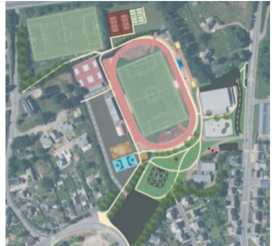
Croquis d'intention ▲

La 1 re phase débutera en 2024 et correspondra à la partie sud du site. Évaluée à 1,9 million TTC elle comprendra à terme en équipements : un skatepark renouvelé, un espace de glisse type "pumptrack", un espace végétalisé au centre pour les familles et la promenade avec un kiosque pour s'abriter ; deux terrains de basket 3x3, un minibasket 6 paniers et le parcours sensibilisation vélo, la mise en sécurité de la tribune et enfin un aménagement pour l'amélioration de la desserte, des circulations, du stationnement ainsi que de la signalétique. ■