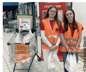
Deux élèves du lycée Saint-Esprit lors de la collecte