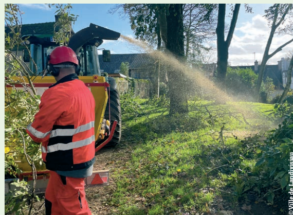
Désencombrer et broyer