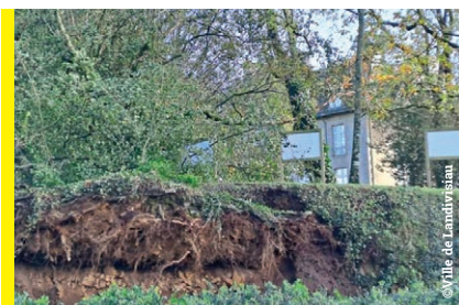
Parc de Krec'h Kellen