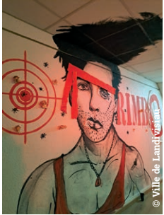
Le combat de Rimbaud et Rambo mené par les élèves de 1 re du Lycée Saint-Esprit

On s'est rassasié de beauté jusqu'à en avoir mal au bide on s'est pas toujours dit au revoir ou à bientôt mais promis on l'a tous pensé tout le monde avait l'air d'avoir la certitude que la poésie sauvera le monde pendant cinq jours ça a fonctionné n'empêche on a sauvé le monde les femmes de toutes leurs couleurs les filles-étoiles-filantes les petits jardins de chacun on leur a donné de la place des phrases de la musique on a dévoré la misère l'enfance l'amour la violence et la guerre et on a crié tout ça avec nos estomacs affamés d'une autre humanité n'empêche on a beau avoir ingurgité tout ça ce soir j'ai encore faim.