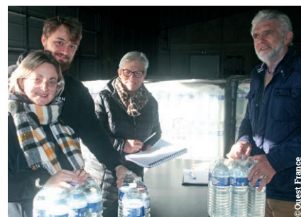
Distribution eau potable

La tempête Ciarán a provoqué d'innombrables dégâts et parmi eux, des ravages au sein du parc de Krec'h Kelenn et de la Vallée du Lapic. La tempête a déraciné des arbres implantés au sein de ces parcs et jardins. Pour la sécurité de tous, plusieurs jours de fermeture ont suivi. ■