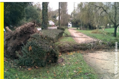
▲ La Vallée du Lapic n'a pas été épargnée