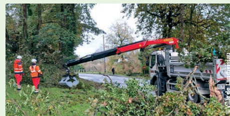
L'élagage des arbres et branches tombés