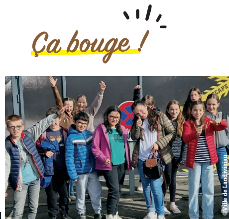
▲ Groupe du Local Jeunes à l'escape game de Morlaix.