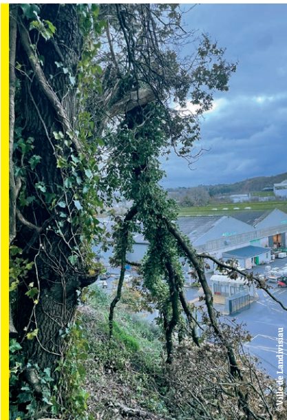
▲ Sur les hauteurs de la zone du Fromeur