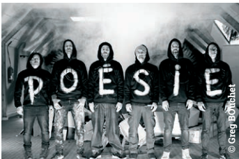
Un gang poétique de haute volée

” Un public nombreux et chaleureux sur tous les rendez-vous