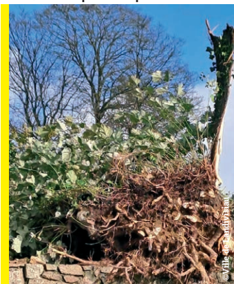
Parc de Krec'h Kellen