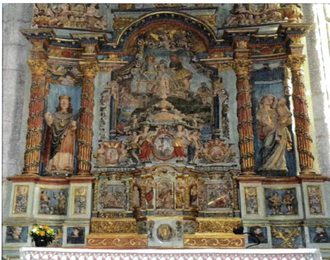
Photo de l'intérieur de l'église St Melar

Un plan de gestion sera élaboré avec des engagements réciproques