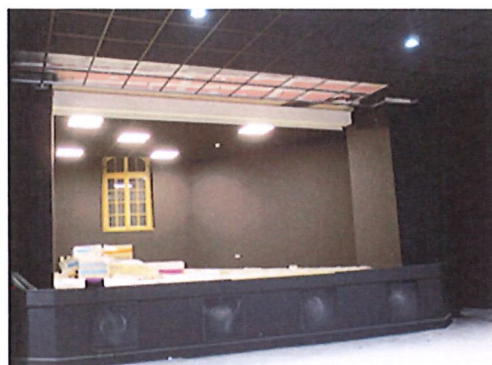
L'écran en place