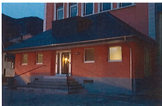
Accès au cinéma