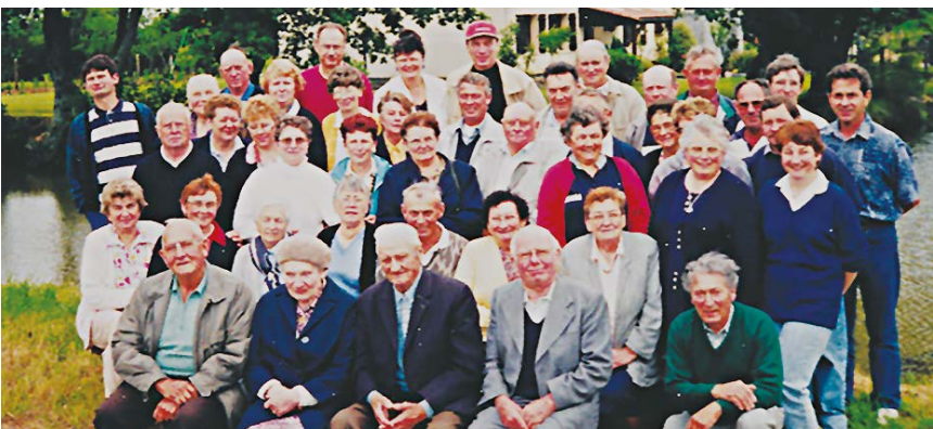
photo souvenir, après la fête, au son de l'accordéon