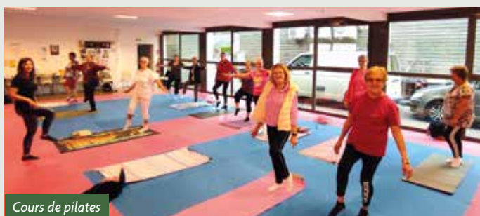
Cours de pilates

L'association présente une incroyable richesse d'activités sportives et culturelles de tout niveau et de tout âge ! Elle représente à elle seule plus de 10 activités différentes : Gym douce, gym tonique, gym adaptée, gym bébé-parents, pilates, yoga, cours d'anglais, cours d'informatique, cours de dentelle, et cours de bridge !