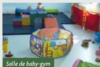
Salle de baby-gym