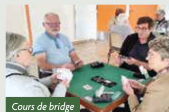
Cours de bridge

La salle de baby-gym est un espace ludique où le jeune enfant développe sa psychomotricité et où ses parents trouvent soutien et conseils.