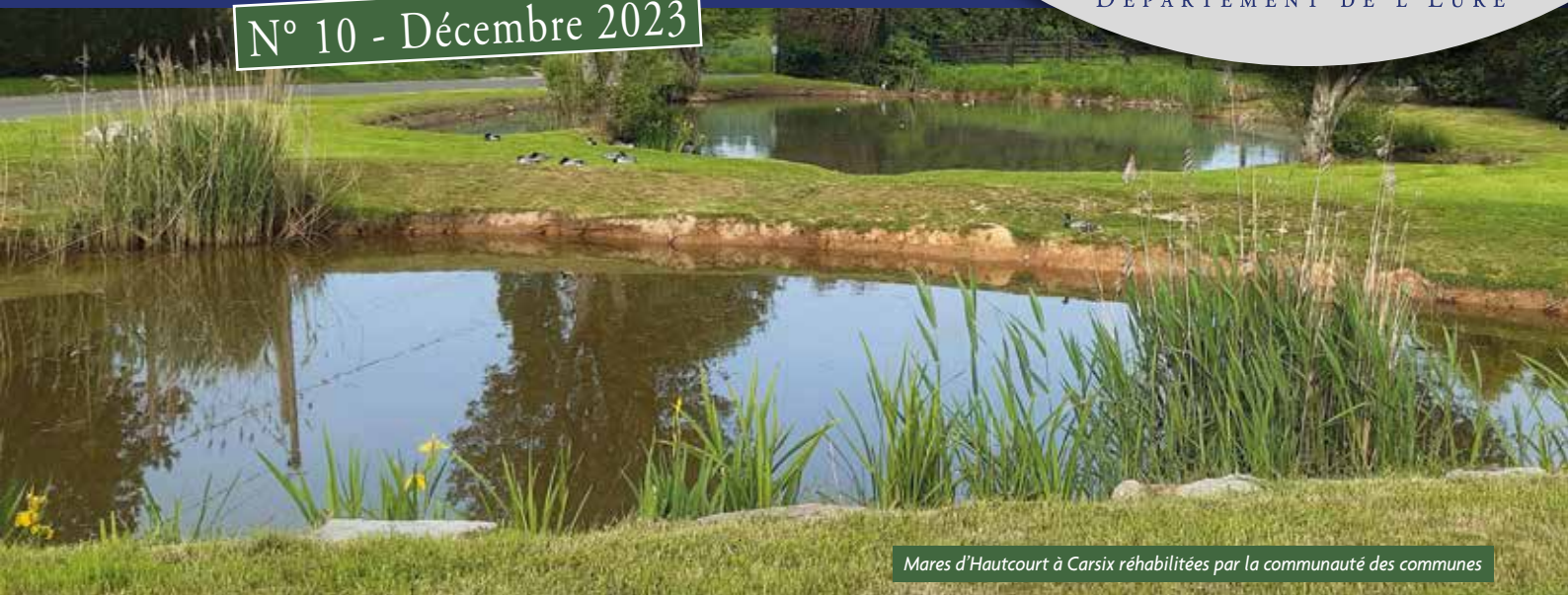
Mares d'Hautcourt à Carsix réhabilitées par la communauté des communes