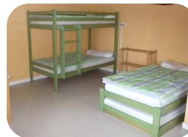
Chambre «Vert Pomme»