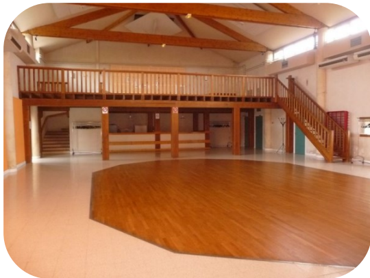
Salle des fêtes (possibilité de location)