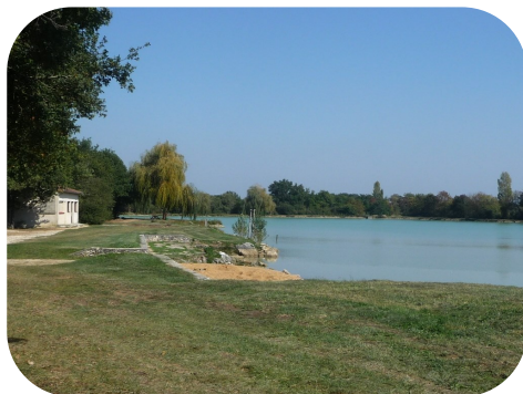
La Base de Loisirs