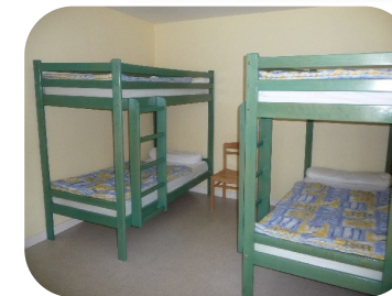
Chambre «Vert Sapin»

Salle d'eau et toilettes privatives pour chaque chambre.