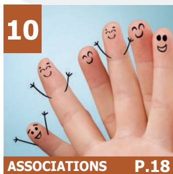
10 ASSOCIATIONS P.18