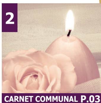
2 CARNET COMMUNAL P.03