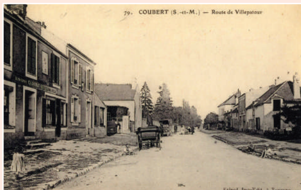
JADIS Rue Eugène DORLET Aristide Briand

Les photos étant plus parlantes, vous trouverez ci-dessous un panel des réalisations des derniers mois.