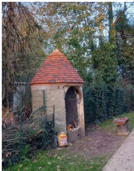
Puits Ruelle du pavillon

Qu'ils concernent les bâtiments communaux, les voies et autres espaces publics, ils se sont poursuivis à un rythme soutenu au cours du dernier semestre. Certains d'entre eux se sont d'ailleurs réalisés sous maîtrise d'ouvrage de la communauté de communes Brie des Rivières et Châteaux comme le raccordement entre les liaisons douces communales et l'entrée du collège.