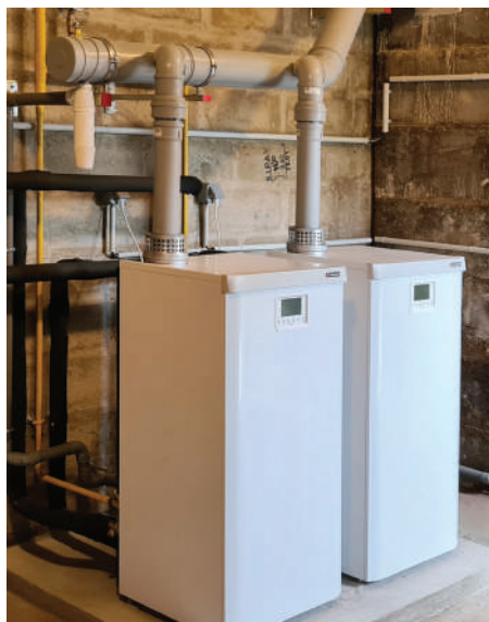
Chaudières école maternelle