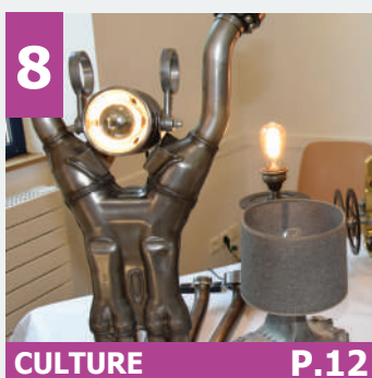
8 CULTURE P.12