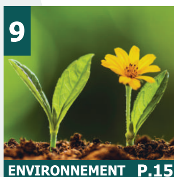
9 ENVIRONNEMENT P.15