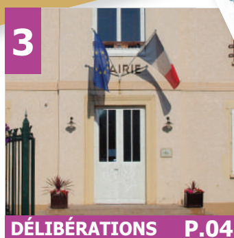
3 DÉLIBÉRATIONS P.04