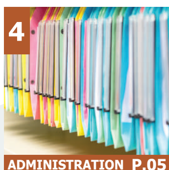
4 ADMINISTRATION P.05