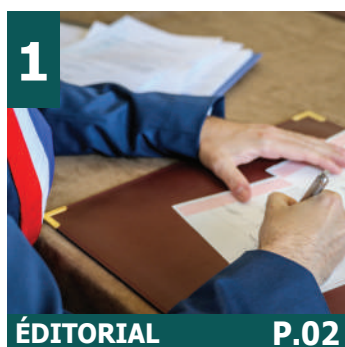
1 ÉDITORIAL P.02