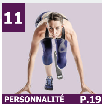
11 PERSONNALITÉ P.19