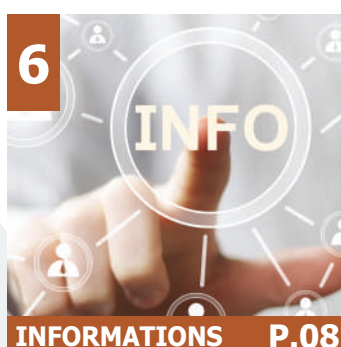
6 INFORMATIONS P.08