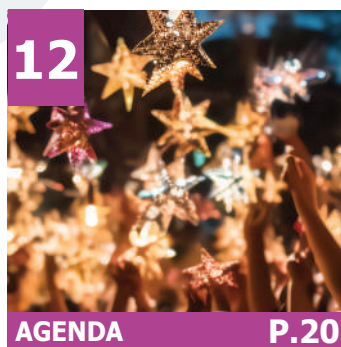
12 AGENDA P.20

L'édition de ce bulletin d'information annuel est rendue possible grâce aux emplacements publicitaires qui permettent d'assurer l'intégralité de son financement. La municipalité tient à remercier l'ensemble des entreprises commerciales, artisanales et industrielles qui ont accepté de mieux faire connaître leurs activités professionnelles en s'associant à la réalisation de ce magazine annuel, dont l'objectif est de promouvoir l'image de notre commune. Remerciements également à toutes les personnes qui ont participé directement ou indirectement à la conception de ce bulletin.