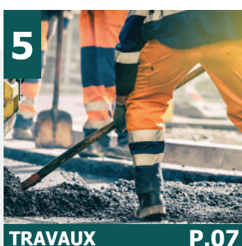
5 TRAVAUX P.07