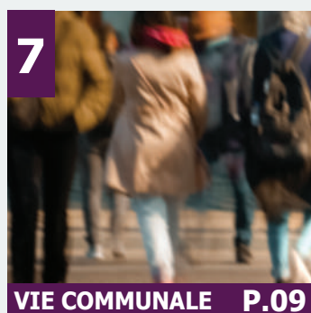
7 VIE COMMUNALE P.09