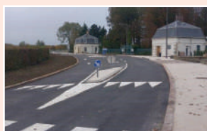
2023 Rue Eugène DORLET Aristide Briand