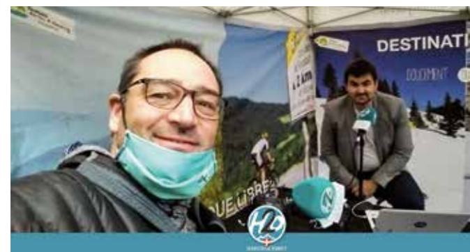
H2O en direct au trail de Faverges Seythenex organisé par LVO.

Depuis son lancement fin 2017, l'association « H2O La radio du Lac d'Annecy » a fait son chemin pour devenir un média local connu ! En juin 2020, la radio a choisi d'intégrer de nouveaux locaux à la Zone Artisanale de la Tuilerie à Saint-Jorioz !