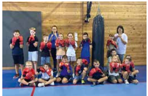
Enfants 8-10 ans

Pour tout renseignement concernant les inscriptions en cours d'année, ou le sponsoring, vous pouvez appeler Roselyne Dray Haelvoet au 06 61 03 77 34 .